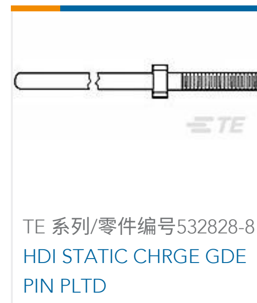
TE 系列/零件编号532828-8 HDI STATIC CHRGE GDE PIN PLTD