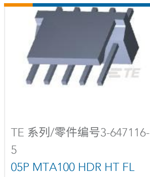
TE 系列/零件编号3-647116-5 05P MTA100 HDR HT FL 30AU LF