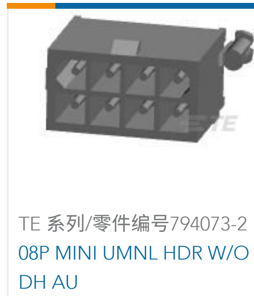
TE 系列/零件编号794073-2 08P MINI UMNL HDR W/O DH AU