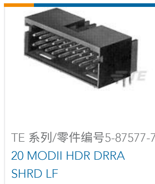
TE 系列/零件编号5-87577-7 20 MODII HDR DRRA SHRD LF