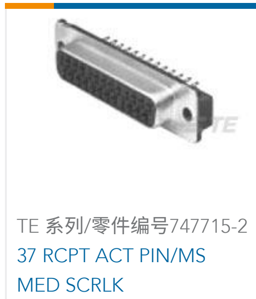
TE 系列/零件编号747715-2 37 RCPT ACT PIN/MS MED SCRLK