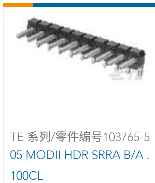
TE 系列/零件编号103765-5 05 MODII HDR SRRA B/A . 100CL