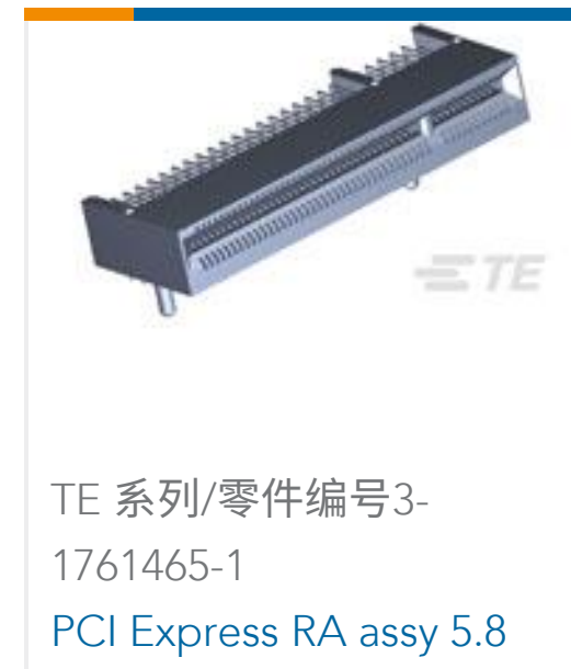
TE 系列/零件编号3- 1761465-1 PCI Express RA assy 5.8 mm slot 2.3mm pc