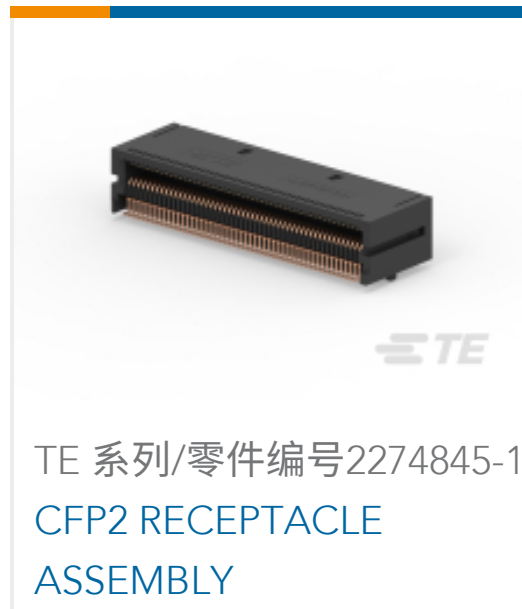
TE 系列/零件编号2274845-1 CFP2 RECEPTACLE ASSEMBLY