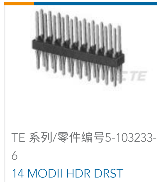
TE 系列/零件编号5-103233- 6 14 MODII HDR DRST UNSHRD A/PIN