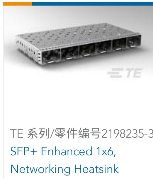
TE 系列/零件编号2198235-3 SFP+ Enhanced 1x6, Networking Heatsink