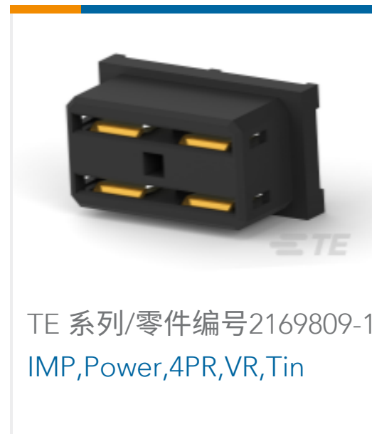
TE 系列/零件编号2169809-1 IMP,Power,4PR,VR,Tin