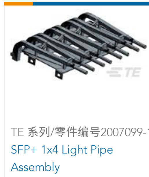
TE 系列/零件编号2007099-1 SFP+ 1x4 Light Pipe Assembly