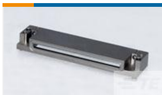
TE 系列/零件编号2057631-1 CFP Receptacle Cover Assy