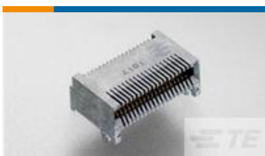
TE 系列/零件编号2110819-1 QSFP+ Enh EVERCLEAR PT Conn