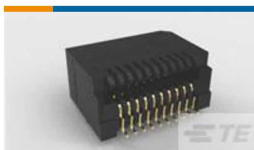
TE 系列/零件编号1888247-1 20 POS SMT CONN, SFP /SFP+, 30A