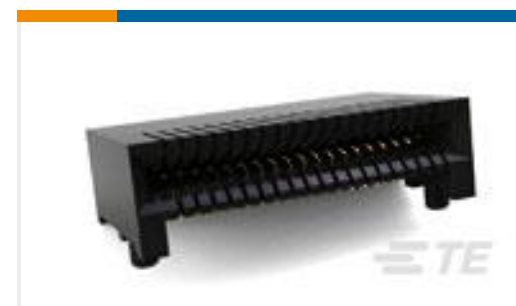
TE 系列/零件编号1761987-9 ReceptacleConnAssm38PosTape /Re