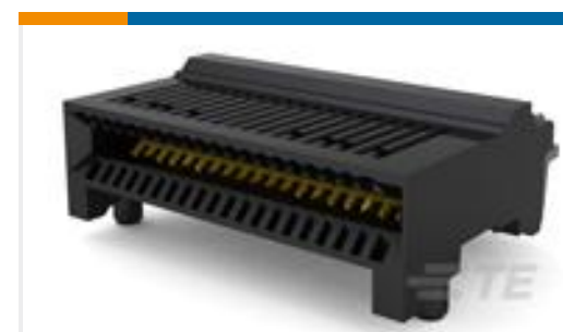
TE 系列/零件编号1551920-2 zQSFP+ connector assembly