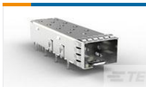
TE 系列/零件编号2007198-1 SFP+ 1x1 Cage Assembly, Press-