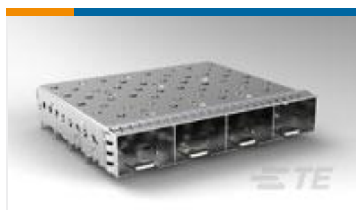
TE 系列/零件编号2007132-1 SFP+ 1X4 Cage Assembly, Press-