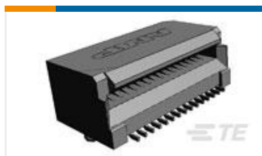
TE 系列/零件编号1367500-1 30 POSN XFP CONN, ENHANCED