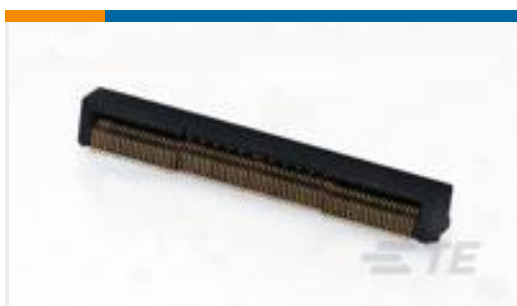
TE 系列/零件编号2057630-1 CFP Receptacle Conn Assy