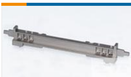
TE 系列/零件编号2057592-2 CFP Guide Rail