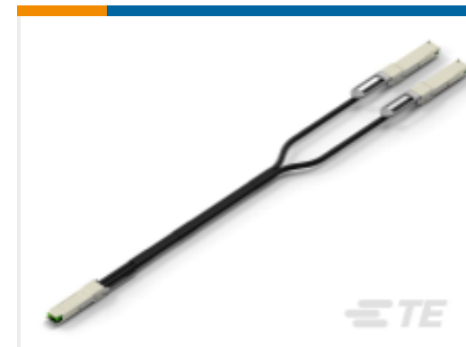
TE 系列/零件编号 2333801-6 QSFP TO (2)QSFP, 25G, 3 METER, 30AWG