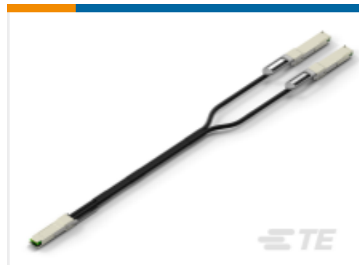
TE 系列/零件编号 2333801-2 QSFP TO (2)QSFP, 25G, 1 METER, 30AWG