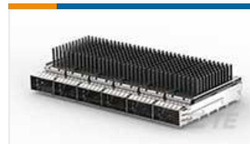
TE 系列/零件编号2170707-6 CAGE ASSY, 1X6, QSFP28, SPRING, HS