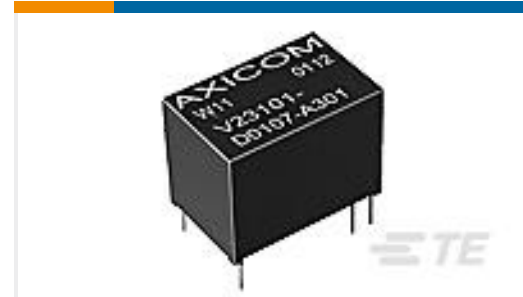
TE 系列/零件编号2- 1393779-1 V23101D 7B301