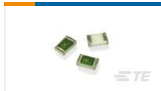
TE 系列/零件编号7- 1879130-3 RN 0402 4K75 0.1% 10PPM CUT LENGTH