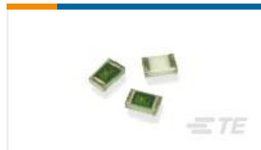
TE 系列/零件编号4- 1614352-7 RN 0603 294R 0.1% 10PPM CUT LENGTH