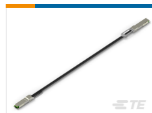
TE 系列/零件编号 2333393-3 QSFP 25GIG 30AWG 1 METER