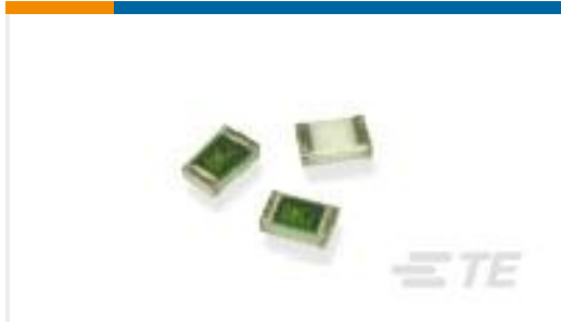
TE 系列/零件编号2- 1614352-9 RN 0603 255R 0.1% 10PPM CUT LENGTH