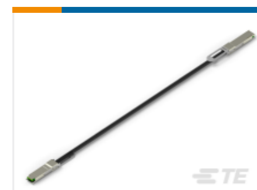
TE 系列/零件编号 2333393-5 QSFP 25GIG 30AWG 2 METER