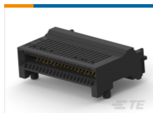
TE 系列/零件编号 1551920-2 zQSFP+ connector assembly