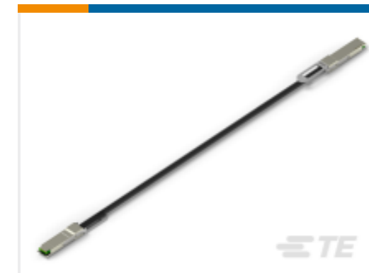
TE 系列/零件编号 2333842-6 QSFP 25GIG 26AWG 3 METER