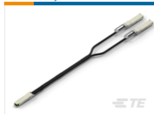
TE 系列/零件编号 2333801-4 QSFP TO (2)QSFP, 25G, 2 METER, 30AWG