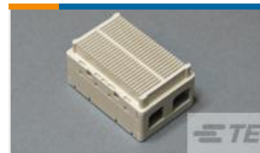
TE 系列/零件编号1-1761617-5 STEP-Z RCPT 15MM 296P PB ST