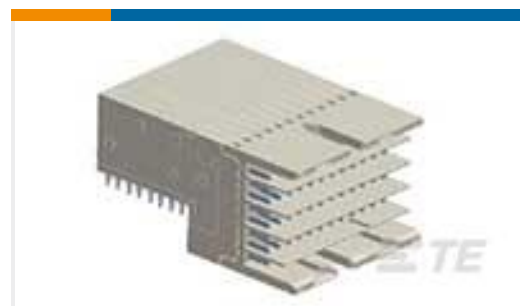
TE 系列/零件编号2042162-2 Right Angle Male Connector