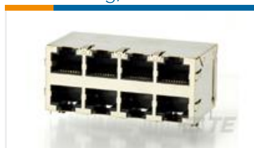
TE 系列/零件编号5569252-1 STK MJ ASSY,8POS,2X4, CAT5