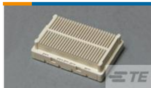
TE 系列/零件编号5-1761617-5 STEP-Z RCPT 05MM 296P LF ST