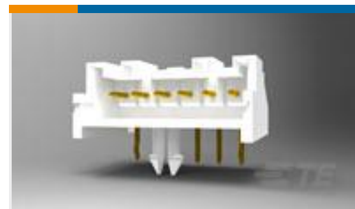
TE 系列/零件编号1744426-9 Header Housing Assy, EP 2.5 RA, 9 Pos.