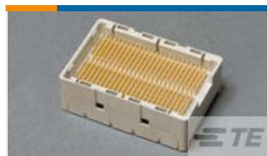
TE 系列/零件编号6-1761616-3 STEP-Z PLUG 13MM 296P LF ST