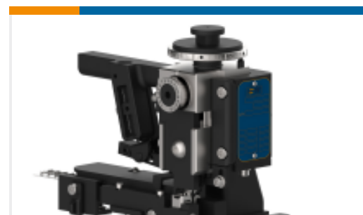
TE 系列/零件编号2266958-1 OCEAN_2.0_Applicator-S- 100F160F