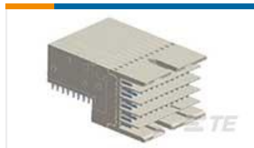
TE 系列/零件编号2042162-1 Right Angle Male Connector