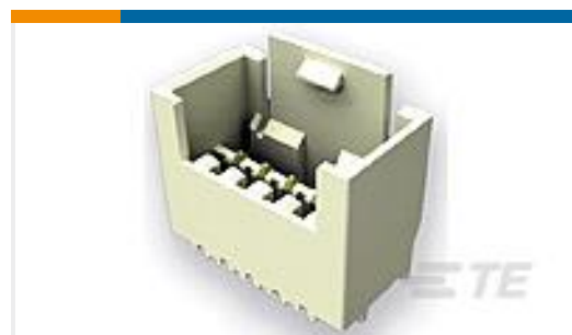
TE 系列/零件编号1-1971818-4 14P,RAST 2.5 Tab Header, Ex- Locking,THV