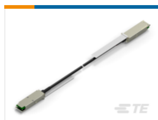
TE 系列/零件编号 2053638-1 C/A, QSFP, 1M, P1-P2, UNEQUALIZED