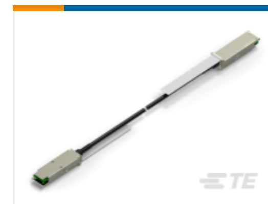
TE 系列/零件编号 2053638-5 C/A, QSFP, 5M, P1-P2, UNEQUALIZED