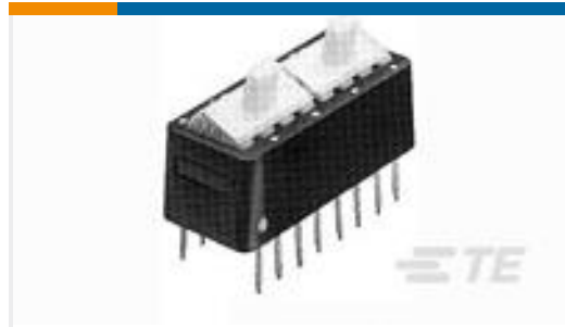
TE 系列/零件编号5-435470-5 DIP SW ASSY-BLK LP ACT-4POS