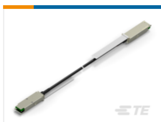
TE 系列/零件编号 2053638-3 C/A, QSFP, 3M, P1-P2, UNEQUALIZED