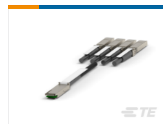
TE 系列/零件编号 2053453-4 C/A, QSFP TO 4XSFP+, 3.0 M