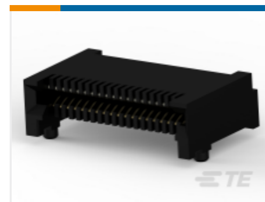
TE 系列/零件编号 2110819-1 QSFP+ Enh EVERCLEAR PT Conn