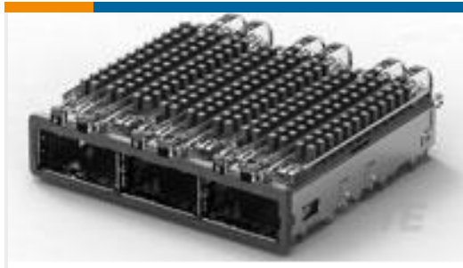
TE 系列/零件编号2110412-2 1x3 QSFP Kit Assy Sqr LP, SAN Htsnk