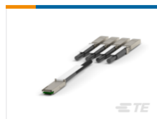
TE 系列/零件编号 2053453-2 C/A, QSFP TO 4XSFP+, 1.0 M