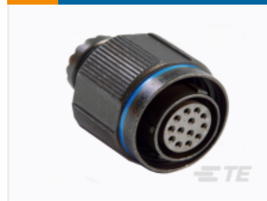
TE 系列/零件编号 YACT26JC08SNV00100 STRAIGHT PLUG