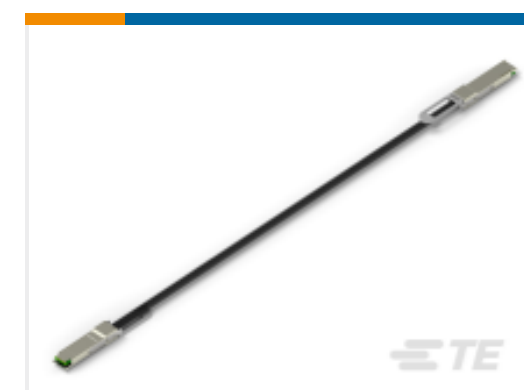
TE 系列/零件编号 2333393-5 QSFP 25GIG 30AWG 2 METER