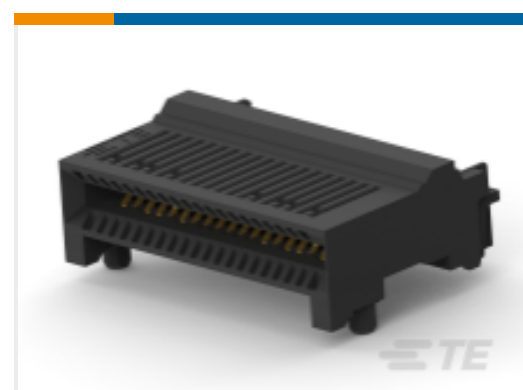
TE 系列/零件编号 1551920-2 zQSFP+ connector assembly