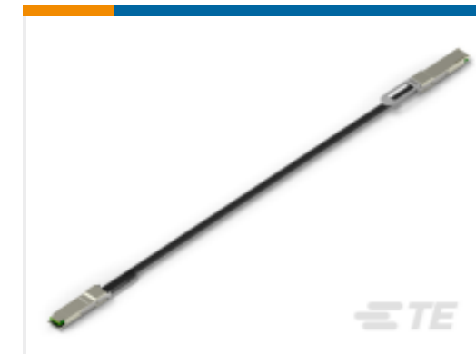
TE 系列/零件编号 2333842-6 QSFP 25GIG 26AWG 3 METER