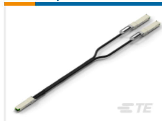
TE 系列/零件编号 2333801-4 QSFP TO (2)QSFP, 25G, 2 METER, 30AWG