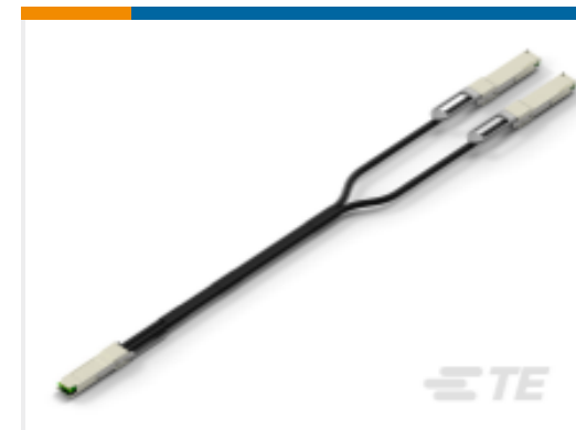
TE 系列/零件编号 2333801-6 QSFP TO (2)QSFP, 25G, 3 METER, 30AWG