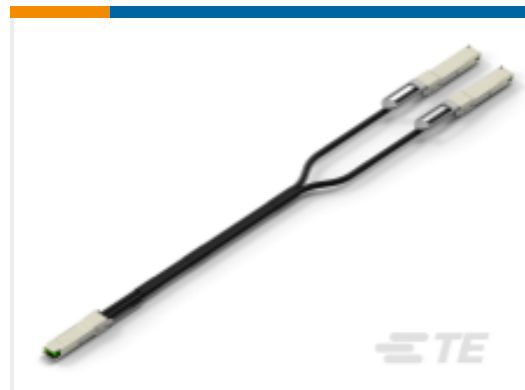
TE 系列/零件编号 2333801-2 QSFP TO (2)QSFP, 25G, 1 METER, 30AWG