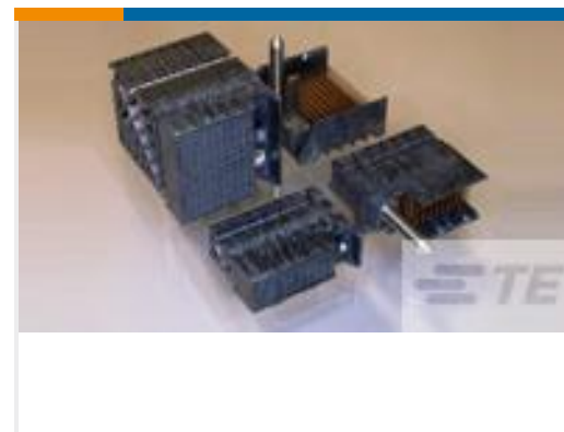
TE 系列/零件编号2007853-2 IMP100S,H,V5P10C,UG, LEW39,4.9