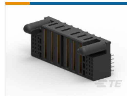
TE 系列/零件编号2204420-9 MULTI-BEAM HD VERTICAL REC. 15S+3P+3P+15