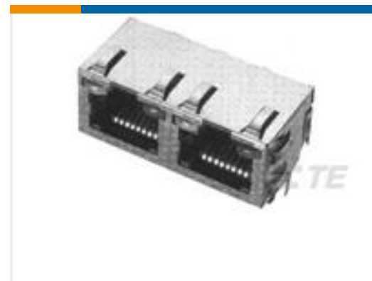
TE 系列/零件编号1761791-5 RJ45 1x2 R/A wiht LED