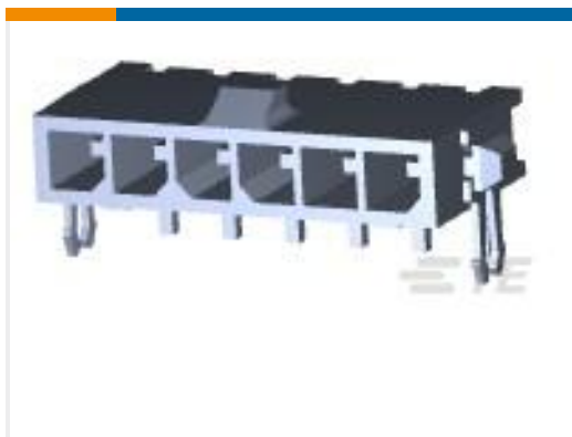
TE 系列/零件编号2-1445097-6 MICRO MNL HDR ASSY S /ROW AU LF