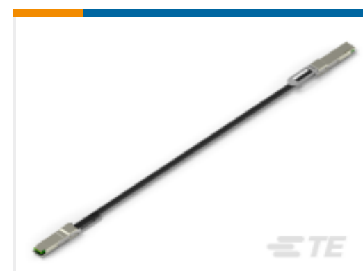
TE 系列/零件编号 2333393-3 QSFP 25GIG 30AWG 1 METER