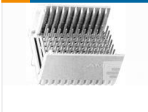
TE 系列/零件编号5646884-1 2MMHM TYPE A/B 125 POS INVERSE