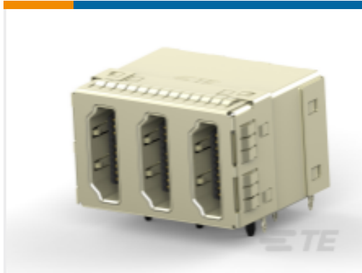
TE 系列/零件编号2295556-1 Std HDMI, Flag, T/H, 3 in 1 (Row)