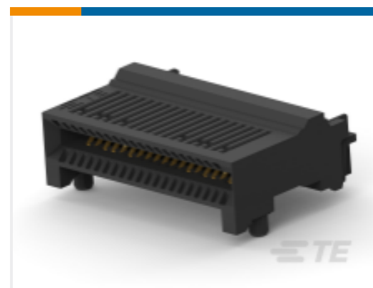
TE 系列/零件编号 1551920-2 zQSFP+ connector assembly