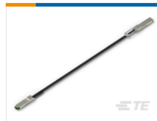
TE 系列/零件编号 2333393-3 QSFP 25GIG 30AWG 1 METER