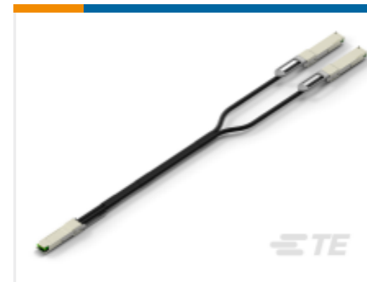
TE 系列/零件编号 2333801-6 QSFP TO (2)QSFP, 25G, 3 METER, 30AWG