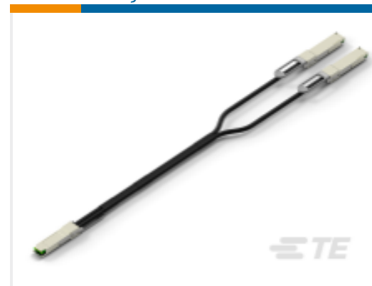
TE 系列/零件编号 2333801-4 QSFP TO (2)QSFP, 25G, 2 METER, 30AWG