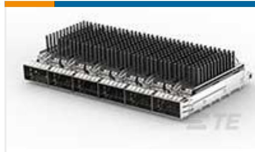
TE 系列/零件编号2170708-3 CAGE ASSY, 1X6, QSFP28, SPRING, HS, LP