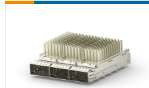
TE 系列/零件编号2170738-6 QSFP28, 1X3, CAGE ASSEMBLY, SPRING, HS