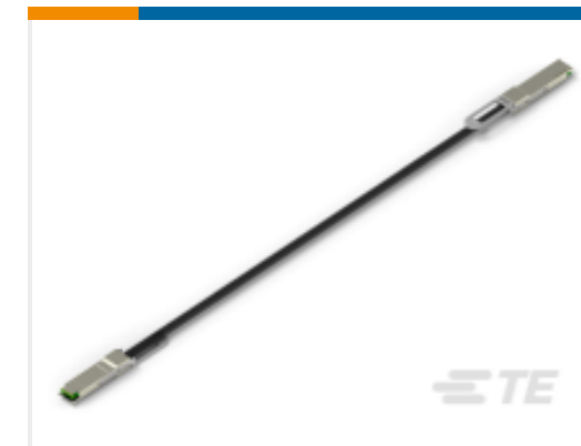
TE 系列/零件编号 2333842-6 QSFP 25GIG 26AWG 3 METER