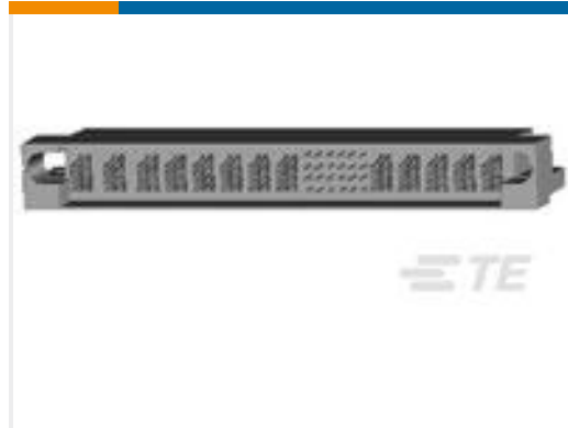
TE 系列/零件编号6450230-3 MBXL R/A HDR 2ACP+6P+24S+5P