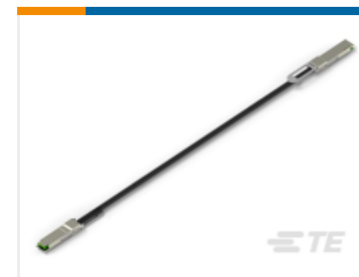
TE 系列/零件编号 2333393-5 QSFP 25GIG 30AWG 2 METER