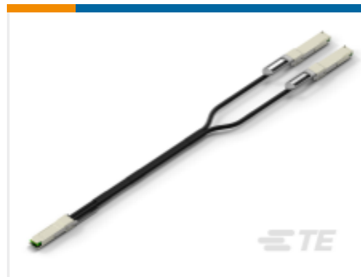
TE 系列/零件编号 2333801-2 QSFP TO (2)QSFP, 25G, 1 METER, 30AWG