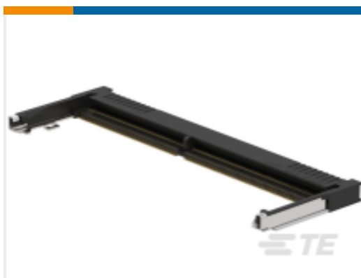
TE 系列/零件编号2309407-3 DDR4 SODIMM 260P 4.0H STD