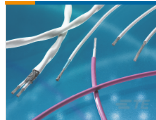
TE 系列/零件编号EF6026- 000 22759/43-4-0