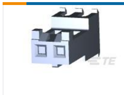
TE 系列/零件编号3-647479- 2 02P MTA156 CONN ASSY 18AWG ORA