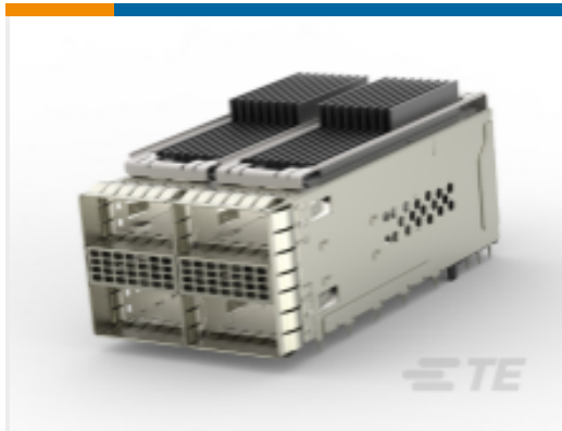
TE 系列/零件编号2299870-3 THERMAL ZQSFP+ STACKED REC ASSEMBLY 2X2