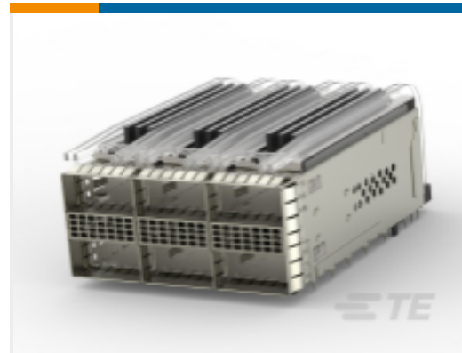
TE 系列/零件编号2299924-5 ZQSFP+ STACKED REC ASSEMBLY 2X3,4LP HS