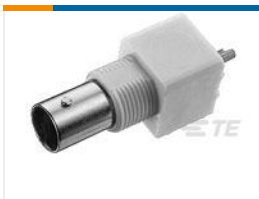
TE 系列/零件编号5415632-2 VERTICAL BNC PCB JACK