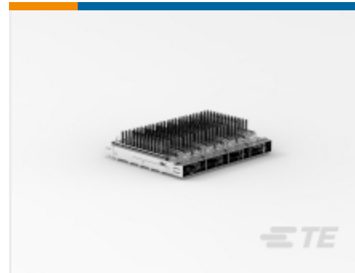
TE 系列/零件编号2170747-3 CAGE ASSY, 1X4, QSFP28, SPRING, HS, LP