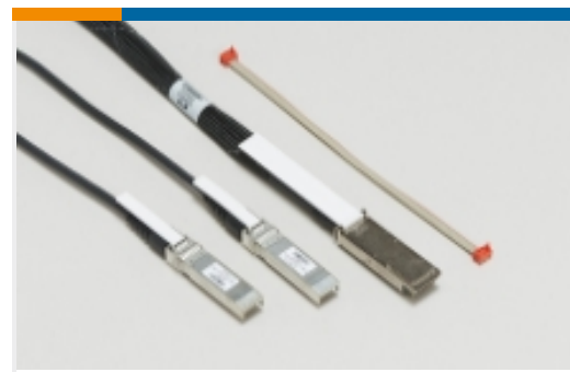
插拔式 I/O 电缆部件(81)