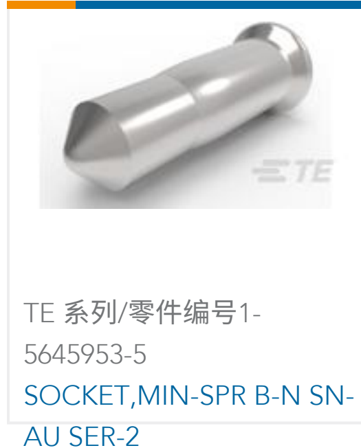
TE 系列/零件编号1-5645953-5 SOCKET,MIN-SPR B-N SN-AU SER-2