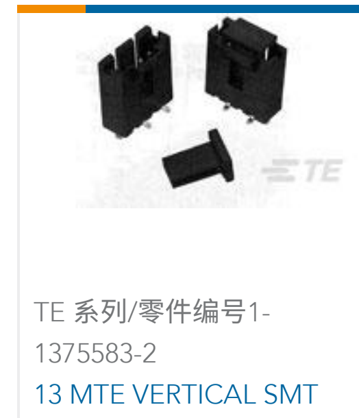
TE 系列/零件编号1-1375583-2 13 MTE VERTICAL SMT HDR 30 AU