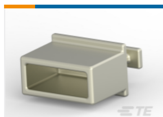
TE 系列/零件编号 1888810-2 EMI/Dust Cover, XFP And QSFP