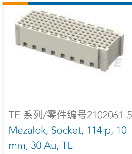
TE 系列/零件编号2102061-5 Mezalok, Socket, 114 p, 10 mm, 30 Au, TL