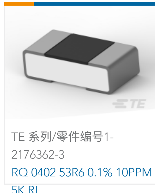
TE 系列/零件编号1-2176362-3 RQ 0402 53R6 0.1% 10PPM 5K RL