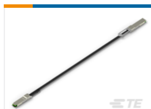
TE 系列/零件编号 2333393-3 QSFP 25GIG 30AWG 1 METER