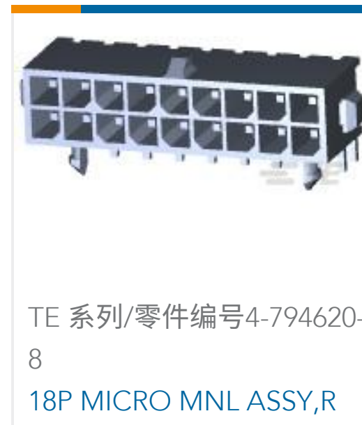
TE 系列/零件编号4-794620-8 18P MICRO MNL ASSY,R /A,HDR,LF