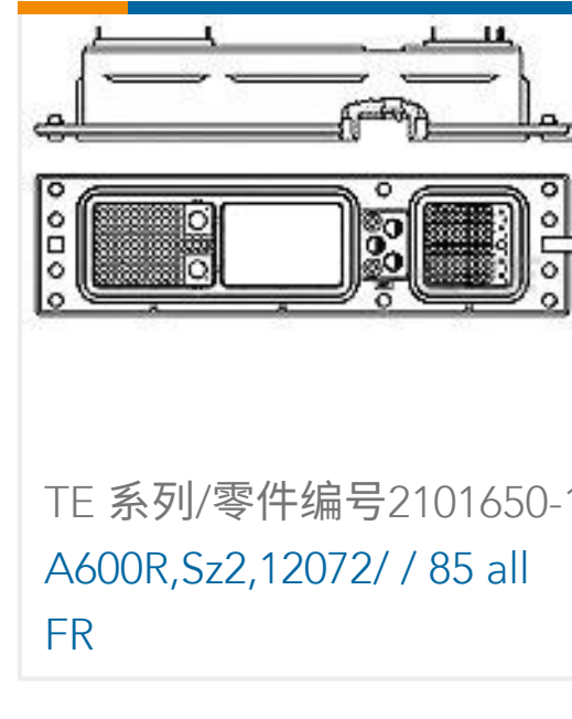
TE 系列/零件编号2101650-1 A600R,Sz2,12072/ / 85 all FR