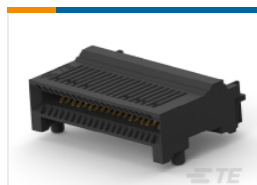
TE 系列/零件编号 1551920-2 zQSFP+ connector assembly