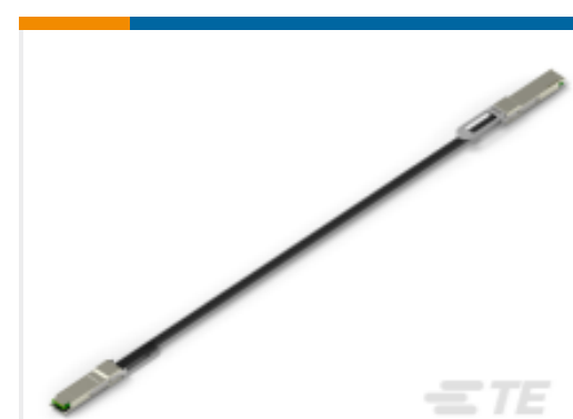
TE 系列/零件编号 2333393-5 QSFP 25GIG 30AWG 2 METER