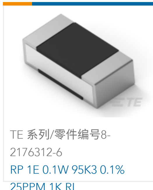
TE 系列/零件编号8-2176312-6 RP 1E 0.1W 95K3 0.1% 25PPM 1K RL