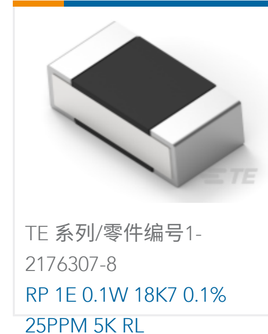
TE 系列/零件编号1-2176307-8 RP 1E 0.1W 18K7 0.1% 25PPM 5K RL