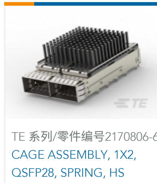
TE 系列/零件编号2170806-6 CAGE ASSEMBLY, 1X2, QSFP28, SPRING, HS