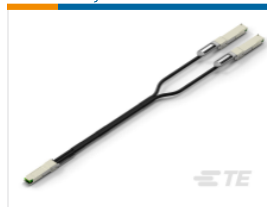
TE 系列/零件编号 2333801-4 QSFP TO (2)QSFP, 25G, 2 METER, 30AWG