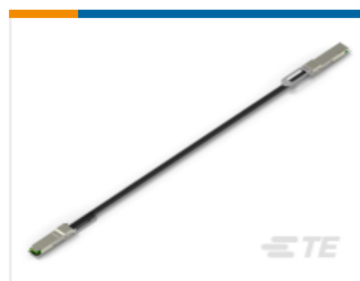
TE 系列/零件编号 2333393-3 QSFP 25GIG 30AWG 1 METER