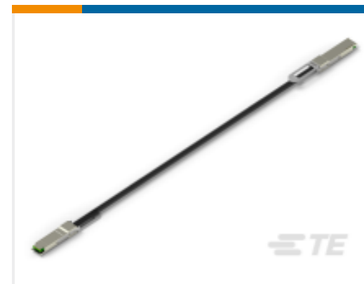
TE 系列/零件编号 2333842-6 QSFP 25GIG 26AWG 3 METER