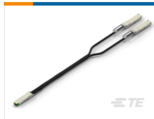
TE 系列/零件编号 2333801-2 QSFP TO (2)QSFP, 25G, 1 METER, 30AWG