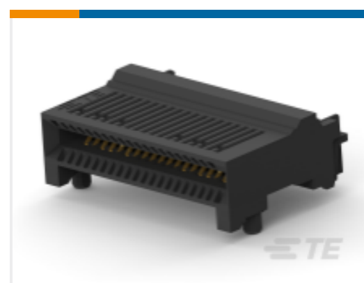
TE 系列/零件编号 1551920-2 zQSFP+ connector assembly