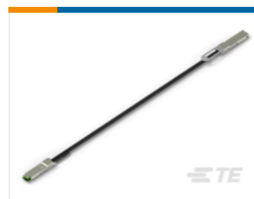
TE 系列/零件编号 2333393-5 QSFP 25GIG 30AWG 2 METER