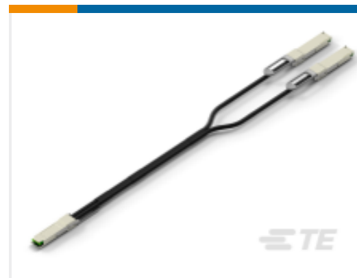
TE 系列/零件编号 2333801-6 QSFP TO (2)QSFP, 25G, 3 METER, 30AWG