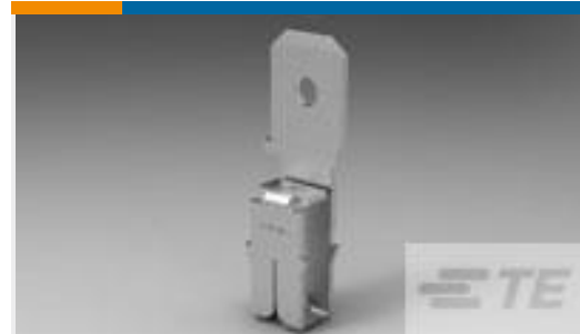
TE 系列/零件编号63664-1 MAG-MATE 27-23 187 FTAB TPBR