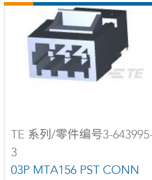
TE 系列/零件编号3-643995-3 03P MTA156 PST CONN ASSY LF