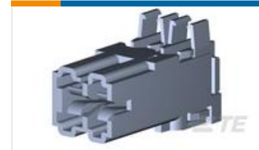
TE 系列/零件编号2-282042-5 AMP MONO-SHAPE 2 POS P.C.B.CON