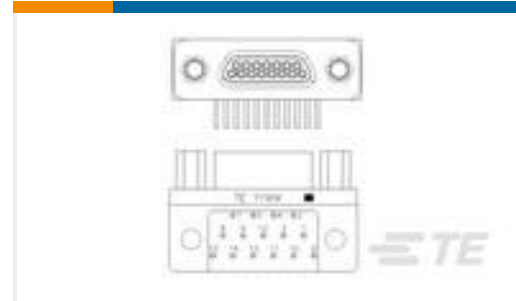
TE 系列/零件编号1532251-2 M83513/10-B01CP = MCKS-C2-P-15PRT1