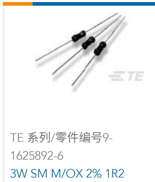
TE 系列/零件编号9-1625892-6 3W SM M/OX 2% 1R2