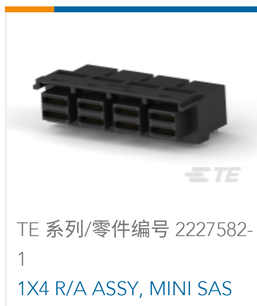
TE 系列/零件编号 2227582-1 1X4 R/A ASSY, MINI SAS HD INTERNAL