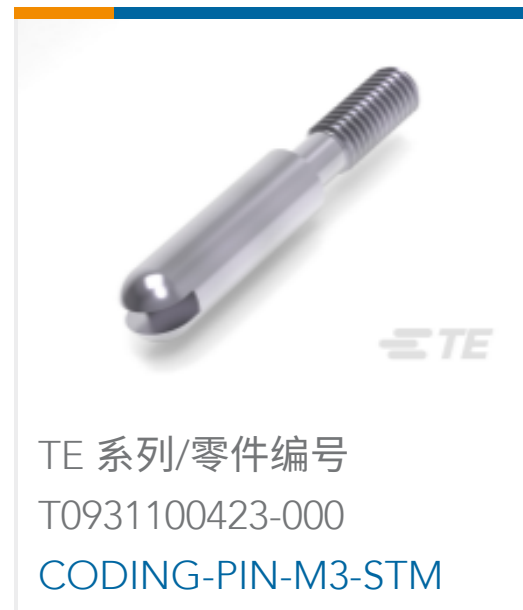
TE 系列/零件编号 T0931100423-000 CODING-PIN-M3-STM