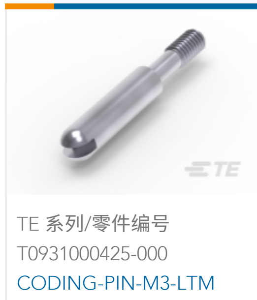
TE 系列/零件编号 T0931000425-000 CODING-PIN-M3-LTM