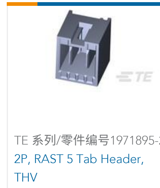
TE 系列/零件编号1971895-2 2P, RAST 5 Tab Header, THV