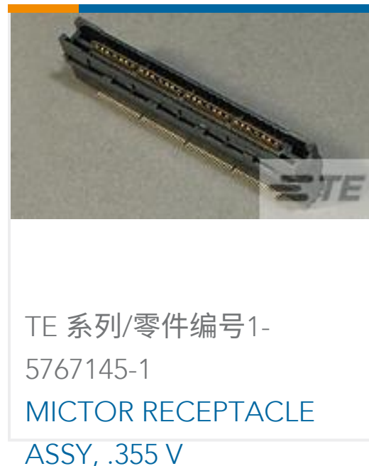
TE 系列/零件编号1- 5767145-1 MICTOR RECEPTACLE ASSY, .355 V