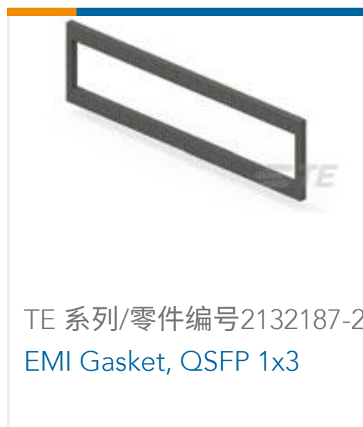
TE 系列/零件编号2132187-2 EMI Gasket, QSFP 1x3