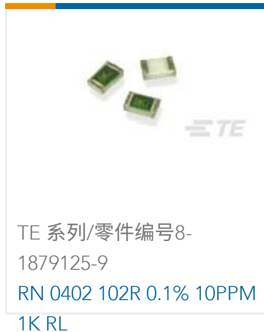
TE 系列/零件编号8- 1879125-9 RN 0402 102R 0.1% 10PPM 1K RL