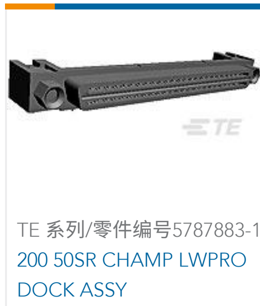
TE 系列/零件编号5787883-1 200 50SR CHAMP LWPRO DOCK ASSY