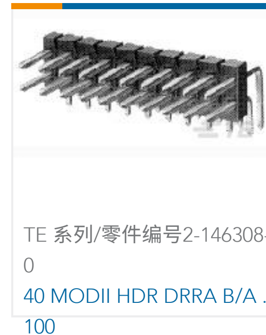
TE 系列/零件编号2-146308- 0 40 MODII HDR DRRA B/A . 100