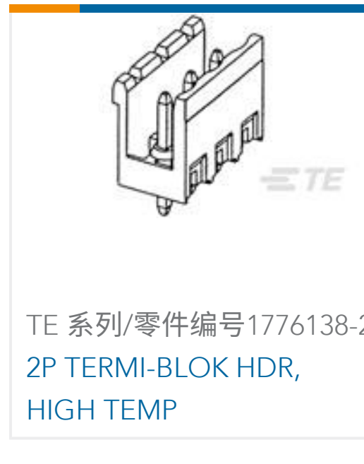
TE 系列/零件编号1776138-2 2P TERMI-BLOK HDR, HIGH TEMP