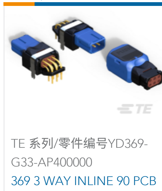
TE 系列/零件编号YD369- G33-AP400000 369 3 WAY INLINE 90 PCB REC, GOLD, PIN