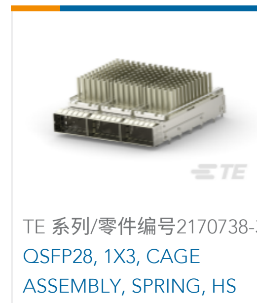
TE 系列/零件编号2170738-3 OSFP28, 1X3, CAGE ASSEMBLY, SPRING, HS