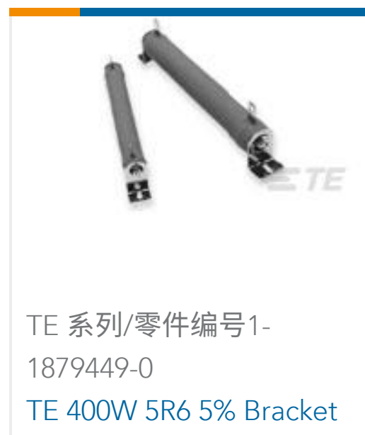
TE 系列/零件编号1- 1879449-0 TE 400W 5R6 5% Bracket