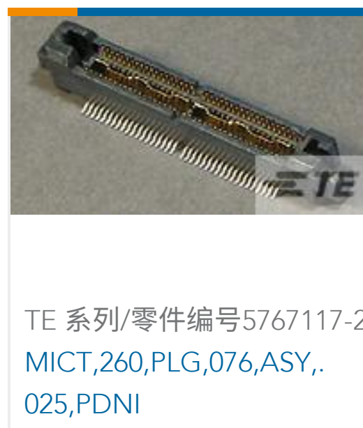
TE 系列/零件编号5767117-2 MICT,260,PLG,076,ASY,. 025,PDNI