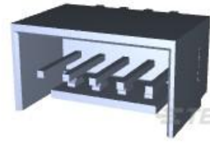
TE 系列/零件编号3-644892-5 05P CST100 SHRD HDR ASSY LF