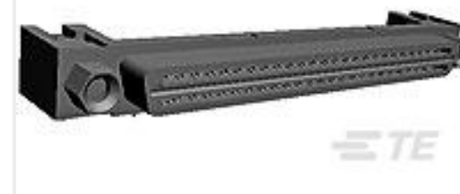
TE 系列/零件编号5787851-2 200 50SR CMP LP R/A RCPT DOCK