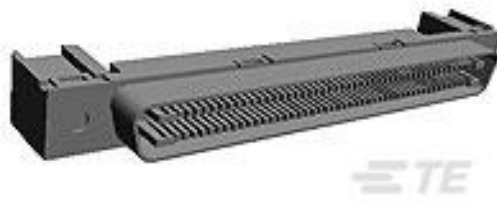
TE 系列/零件编号5787855-2 200 CMP DCK RA PLG REV SEQ3.18