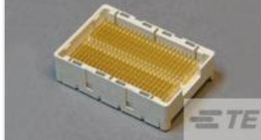
TE 系列/零件编号1-1761614-0 STEP-Z PLUG 10MM 200P PB ST