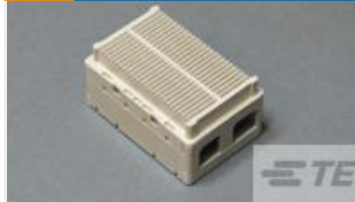
TE 系列/零件编号1-1761615-5 STEP-Z RCPT 15MM 200P PB ST