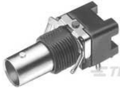
TE 系列/零件编号5415085-1 JACK,DECOUPLER,ESD, 75 OHM