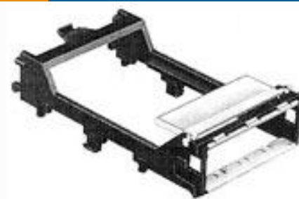
TE 系列/零件编号787663-4 MEDIA CONV ASSY, .100 PCB, NEW