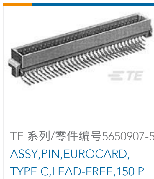
TE 系列/零件编号5650907-5 ASSY,PIN,EUROCARD, TYPE C,LEAD-FREE,150 P