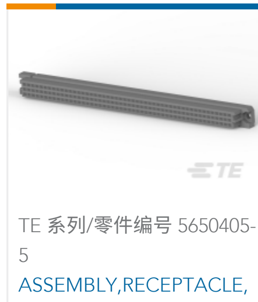
TE 系列/零件编号 5650405-5 ASSEMBLY,RECEPTACLE, EUROCARD,T