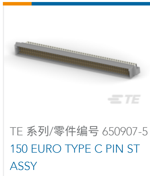
TE 系列/零件编号 650907-5 150 EURO TYPE C PIN ST ASSY