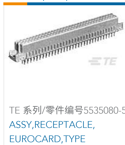
TE 系列/零件编号5535080-5 ASSY,RECEPTACLE, EUROCARD,TYPE