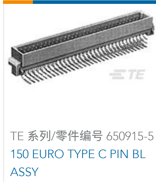
TE 系列/零件编号 650915-5 150 EURO TYPE C PIN BL ASSY