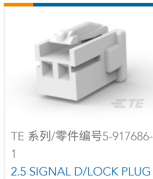
TE 系列/零件编号5-917686-1 2.5 SIGNAL D/LOCK PLUG HSG 2P(GWT)