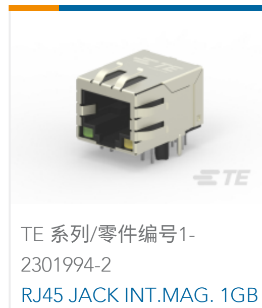
TE 系列/零件编号1-2301994-2 RJ45 JACK INT.MAG. 1GB LED 1X1