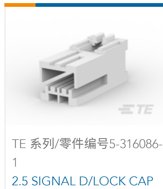
TE 系列/零件编号5-316086-1 2.5 SIGNAL D/LOCK CAP HSG 2P(GWT)