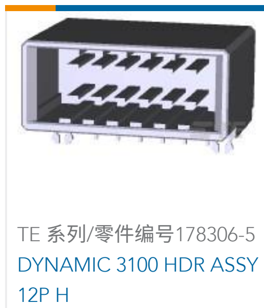
TE 系列/零件编号178306-5 DYNAMIC 3100 HDR ASSY 12P H