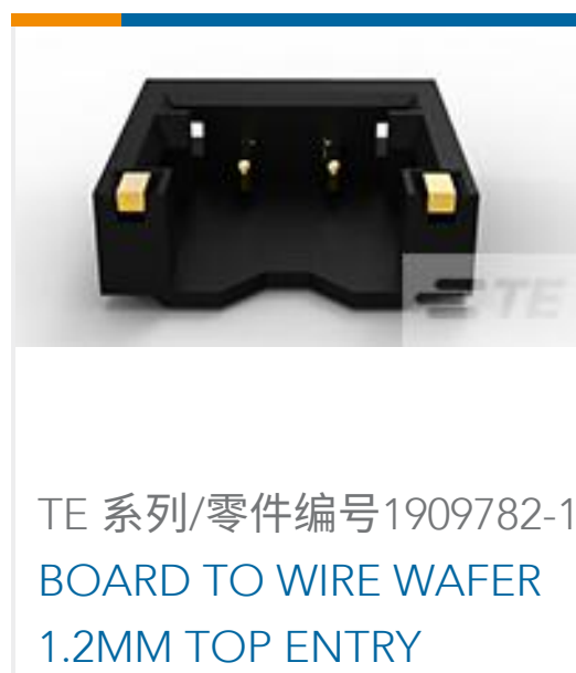
TE 系列/零件编号1909782-1 BOARD TO WIRE WAFER 1.2MM TOP ENTRY