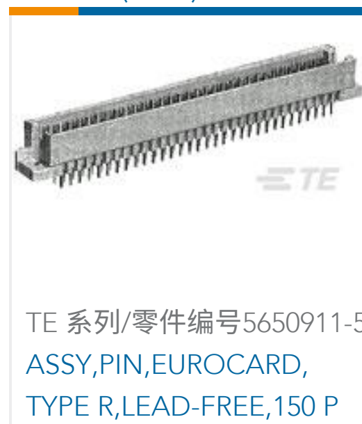
TE 系列/零件编号5650911-5 ASSY,PIN,EUROCARD, TYPE R,LEAD-FREE,150 P