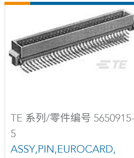
TE 系列/零件编号 5650915-5 ASSY,PIN,EUROCARD, TYPE C,LEAD-FREE,150 P