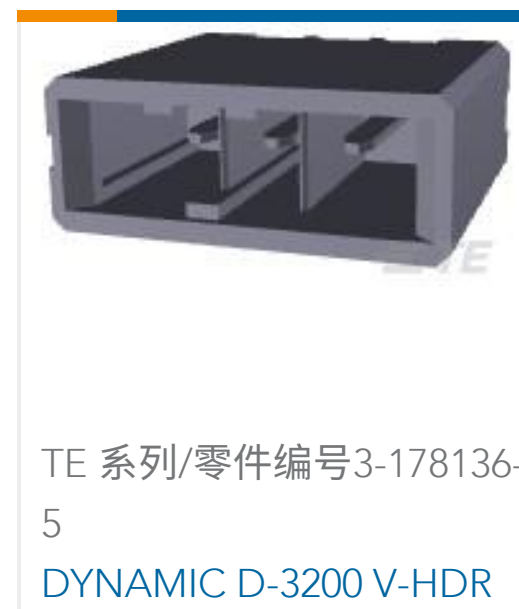
TE 系列/零件编号3-178136-5 DYNAMIC D-3200 V-HDR ASSY 3P Z