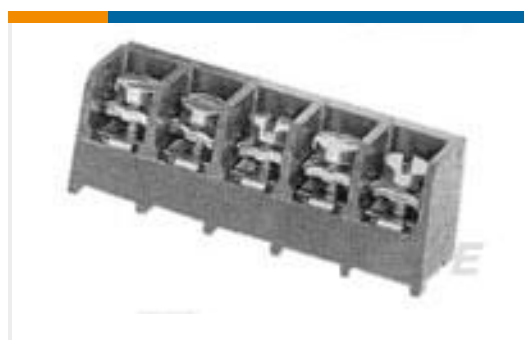
TE 系列/零件编号1437652-5 6PCR-09-006=#6 TRIBARRIER