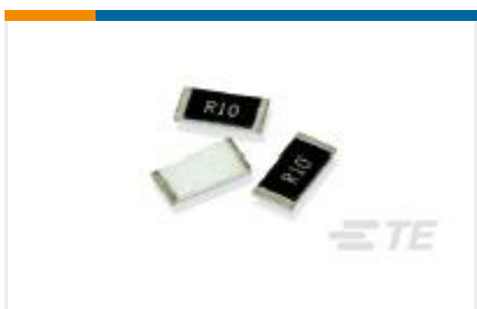
TE 系列/零件编号2176051-1 RLP73M 1J R051 1% 1K RL