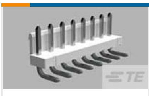
TE 系列/零件编号647676-7 3.96 EP HDR ASSY 7P R/A