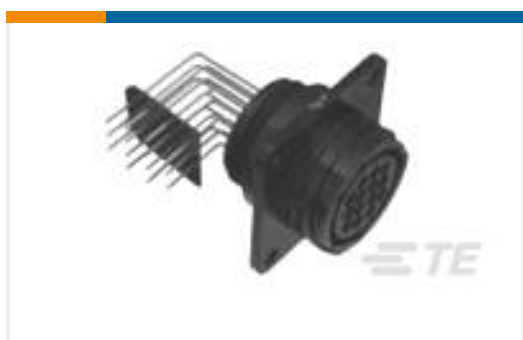
TE 系列/零件编号796500-2 CPC POSTED RCPT,13-7,R /A