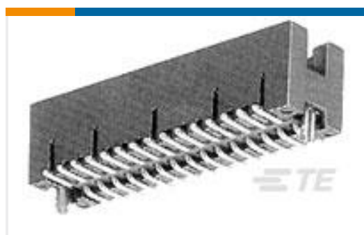
TE 系列/零件编号5-147121- 1 10 50/50 HDR DRST SMT. 250 SN