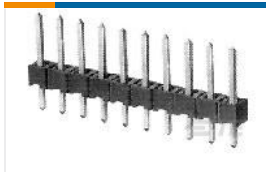
TE 系列/零件编号103321-7 07 MODII HDR SRST B/A . 100CL