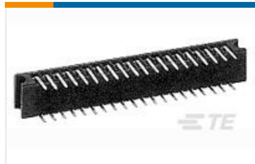
TE 系列/零件编号1-534204- 2 MODU 2-PC CE RECP ASSY 40 POS