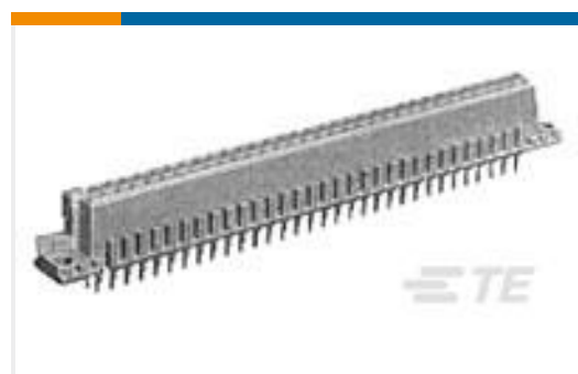
TE 系列/零件编号536460-5 032 EURO TYPE B RECEPT BL ASSY