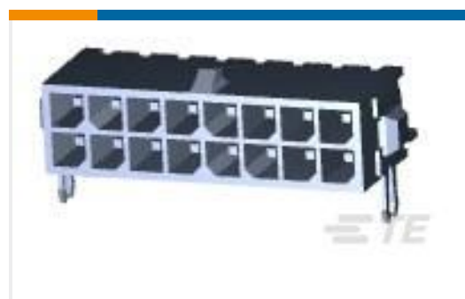
TE 系列/零件编号4-794626- 6 16P MICRO MNL ASSY,R /A,SMT,LF