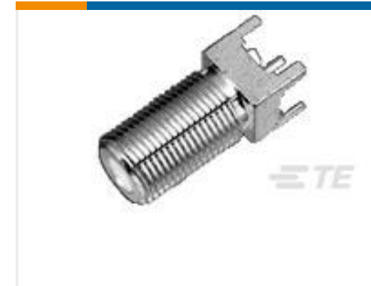
TE 系列/零件编号5887046-1 JACK,PCB,VERTICAL,F SERIES