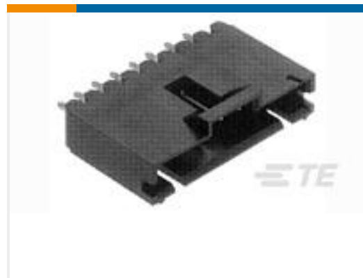
TE 系列/零件编号6-103908- 5 16 MTE HDR SRST LATCH W/HLDWN