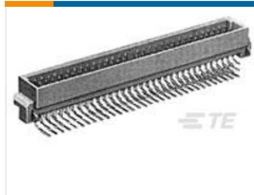
TE 系列/零件编号5650949-5 ASSY,PIN,EUROCARD, TYPE C,LEAD-FREE,120 P