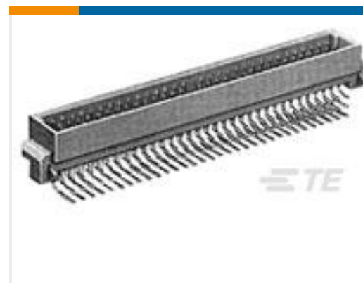
TE 系列/零件编号5650906-5 ASSY,PIN,EUROCARD, TYPE C,LEAD-