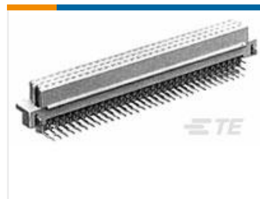
TE 系列/零件编号5650874-5 ASSY,RECEPTACLE, EUROCARD,TYPE