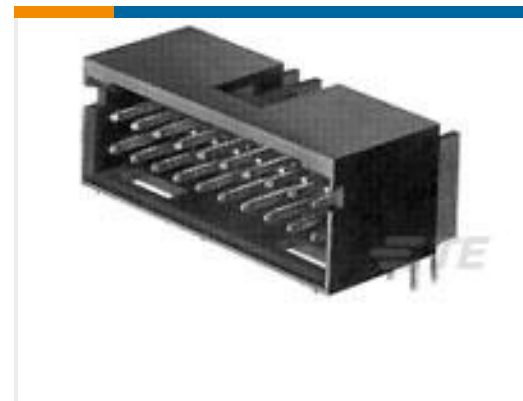
TE 系列/零件编号6-102617- 5 34 MODII HDR DRRA SHRD LF