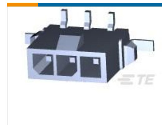
TE 系列/零件编号2- 1445087-3 MICRO MNL HDR ASSY S /ROW AU LF