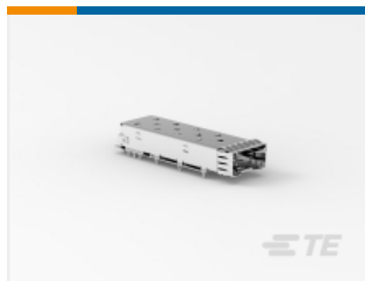
TE 系列/零件编号2274001-1 ZSFP+ 1X1 CAGE ASSEMBLY PRESSFIT