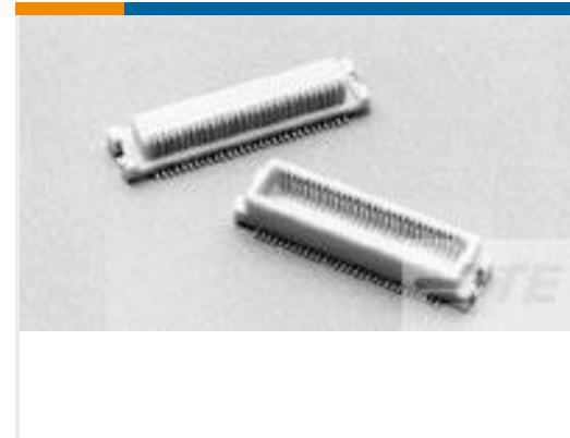
TE 系列/零件编号5- 1747022-3 ON TAPING(EMBOSS) 0.5 MM PITCH