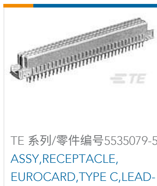
TE 系列/零件编号5535079-5 ASSY, RECEPTACLE, EUROCARD, TYPE C, LEAD- FRE