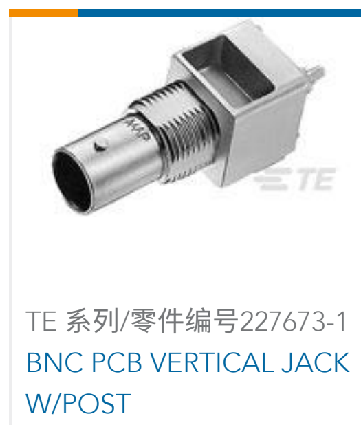
TE 系列/零件编号227673-1 BNC PCB VERTICAL JACK W/POST