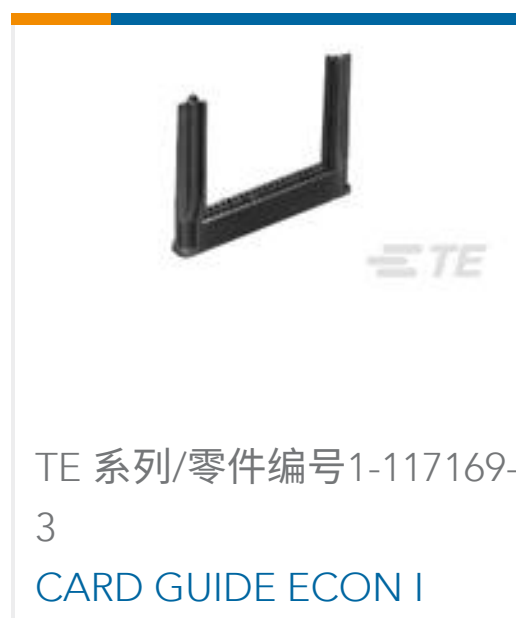
TE 系列/零件编号1-117169- 3 CARD GUIDE ECON I