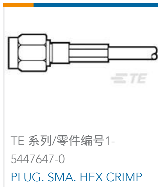
TE 系列/零件编号1- 5447647-0 PLUG. SMA. HEX CRIMP COMM