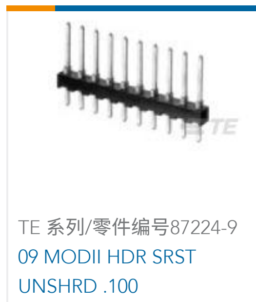
TE 系列/零件编号87224-9 09 MODII HDR SRST UNSHRD .100