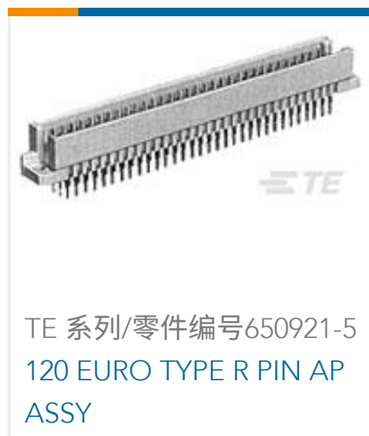
TE 系列/零件编号650921-5 120 EURO TYPE R PIN AP ASSY