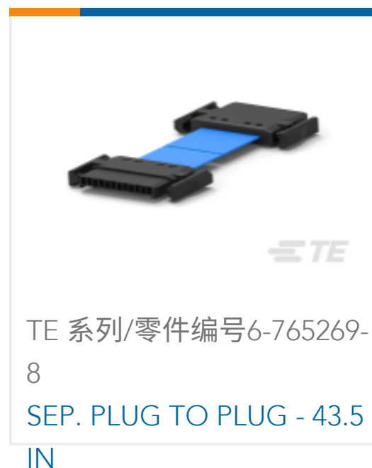
TE 系列/零件编号6-765269- 8 SEP. PLUG TO PLUG - 43.5 IN