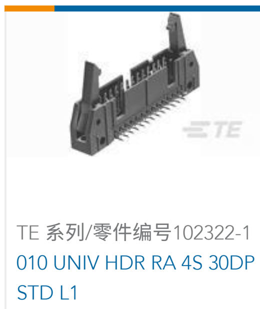
TE 系列/零件编号102322-1 010 UNIV HDR RA 4S 30DP STD L1