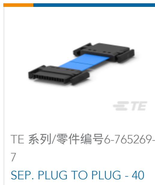
TE 系列/零件编号6-765269- 7 SEP. PLUG TO PLUG - 40 INCHES