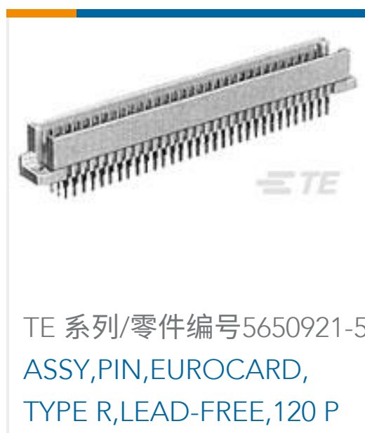
TE 系列/零件编号5650921-5 ASSY, PIN, EUROCARD, TYPE R, LEAD-FREE, 120 P