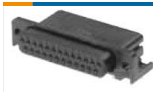
TE 系列/零件编号5747460-3 HD-20 RCPT 15P RA 590 THD INS