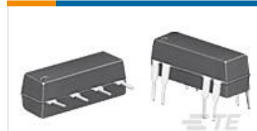
TE 系列/零件编号1- 1393771-8 JWD-171-27=REED RELAYS