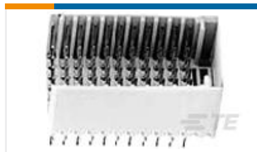
TE 系列/零件编号5106081-1 2MM HM, HEADER, TYPE C