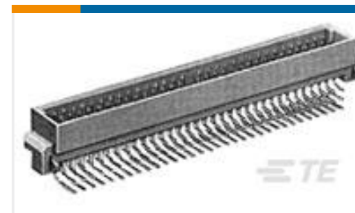
TE 系列/零件编号650946-5 032 EURO TYPE C PIN ST ASSY