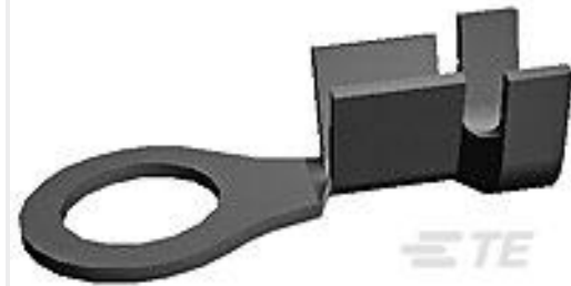
TE 系列/零件编号61289-1 RING 12-8 AWG TPBR