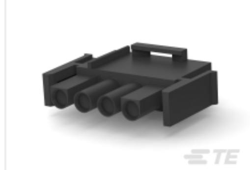
TE 系列/零件编号1-350779-9 04P UMNL V0 PLUG HSG BLACK