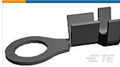
TE 系列/零件编号160701-2 RING TONGUE 18-14 AWG .030 X .394 NPSTL