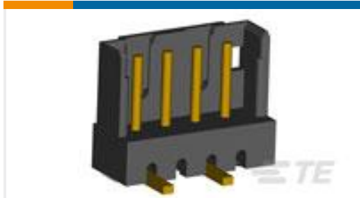
TE 系列/零件编号292172-8 CT POST HDR ASSY 8P IN- TUBE BL