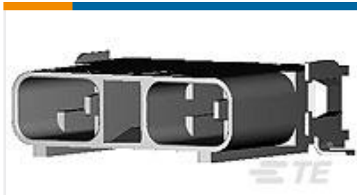
TE 系列/零件编号2106056-8 Assembly, Right Angle SMT Header, 4-Posi