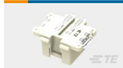
TE 系列/零件编号2154829-2 High Power Inverted Thru Board Con 3 Pos