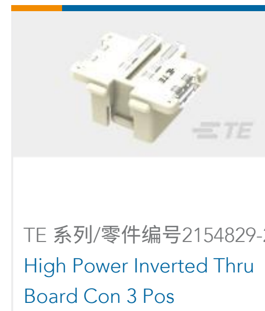
TE 系列/零件编号2154829-2 High Power Inverted Thru Board Con 3 Pos