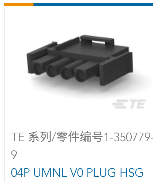
TE 系列/零件编号1-350779-9 04P UMNL V0 PLUG HSG BLACK