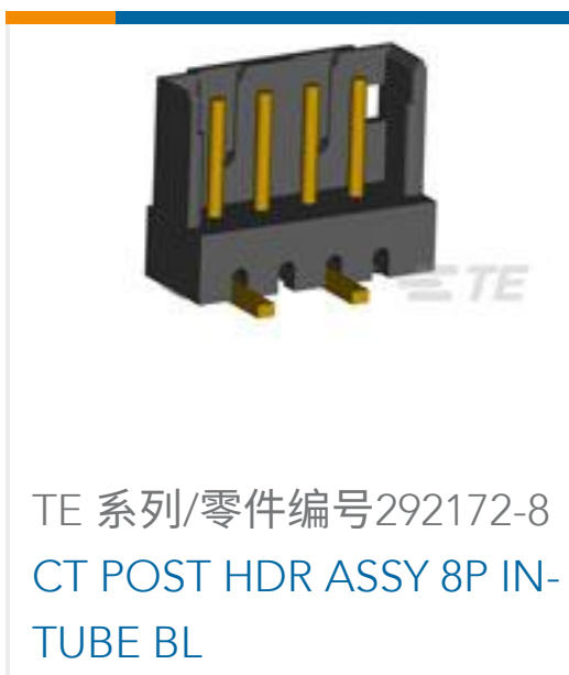
TE 系列/零件编号292172-8 CT POST HDR ASSY 8P IN- TUBE BL