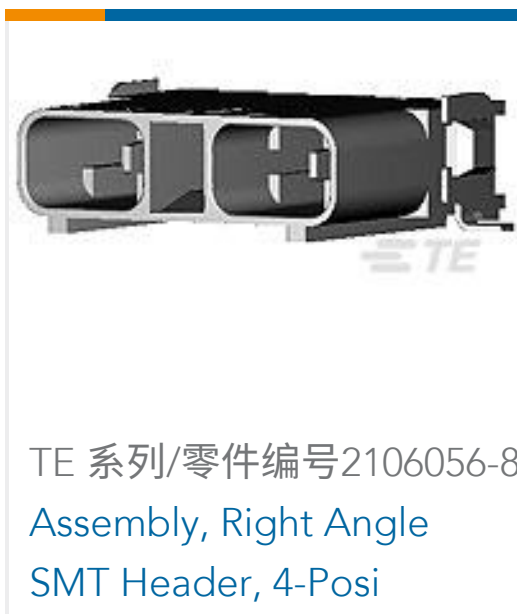
TE 系列/零件编号2106056-8 Assembly, Right Angle SMT Header, 4-Posi