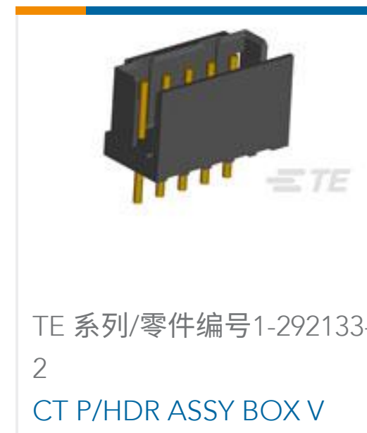
TE 系列/零件编号1-292133-2 CT P/HDR ASSY BOX V 12P W/O KI