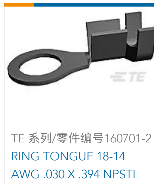
TE 系列/零件编号160701-2 RING TONGUE 18-14 AWG .030 X .394 NPSTL