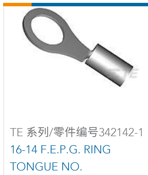
TE 系列/零件编号342142-1 16-14 F.E.P.G. RING TONGUE NO.