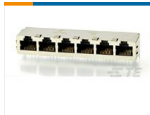
TE 系列/零件编号5406554-8 INV MJ,1X6,PNL GRD,LED (G/Y)