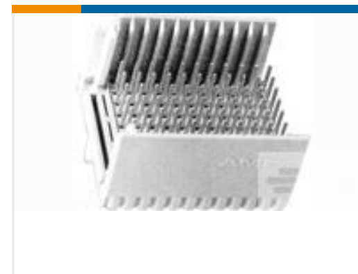
TE 系列/零件编号5646884-1 2MMHM TYPE A/B 125 POS INVERSE