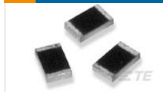
TE 系列/零件编号2- 1879252-0 RP 2B 5R49 0.1% 15PPM 1K RL