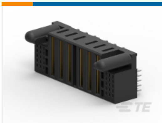
TE 系列/零件编号2204420-9 MULTI-BEAM HD VERTICAL REC. 15S+3P+3P+15