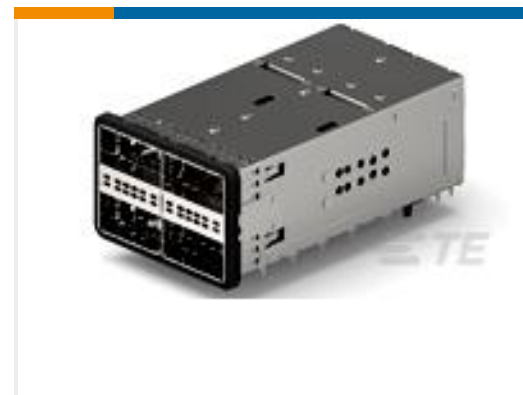
TE 系列/零件编号2214593-1 zQSFP+ STACKED RECEPTACLE ASSEMBLY 2X2