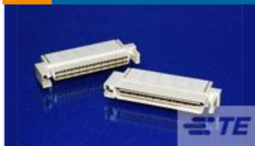
TE 系列/零件编号6367555-2 ASSY Z-DOK+6 ADAPTER BRD 40PR