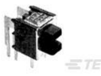
TE 系列/零件编号4- 1437571-1 TPA21CCGRA0=SWITCH P /B N/O BLA