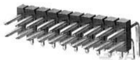
TE 系列/零件编号103149-7 14 MODII HDR DRR A B/A . 100CL