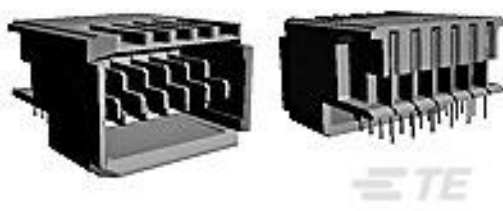
TE 系列/零件编号120954-2 UPM EXPANDED PIN ASSEMBLY