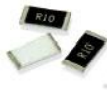
TE 系列/零件编号2176051-7 RLP73M 1J R091 1% 1K RL