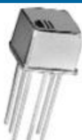
TE 系列/零件编号3- 1617146-4 JMGACDG-12LW = M39016/18-052L