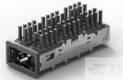
TE 系列/零件编号2057855-1 Cage Assy w/ Hsink QSFP Behind Bezel