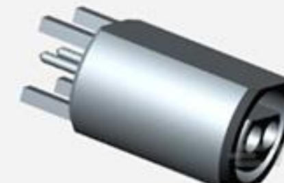
TE 系列/零件编号5-330873- 0 TWIN THREADED PCB RCPT