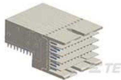
TE 系列/零件编号2042162-2 Right Angle Male Connector