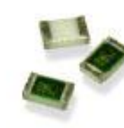
TE 系列/零件编号4- 1614973-6 CPF 1206 2K55 0.1% 25PPM 1K RL