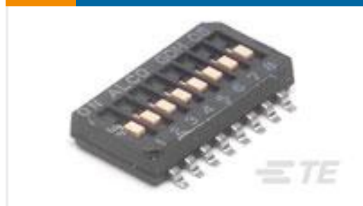
TE 系列/零件编号1571983-1 GDH02S04=DIP SWITCH