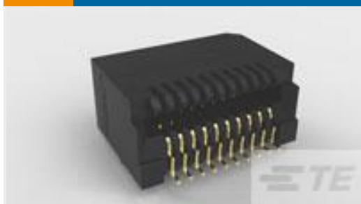
TE 系列/零件编号1888247-1 20 POS SMT CONN, SFP /SFP+, 30A