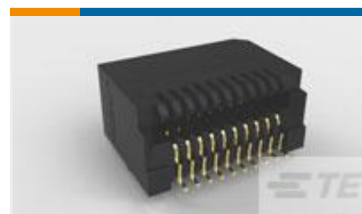
TE 系列/零件编号1367073-1 20 POS SMT CONN, SFP, 15AU