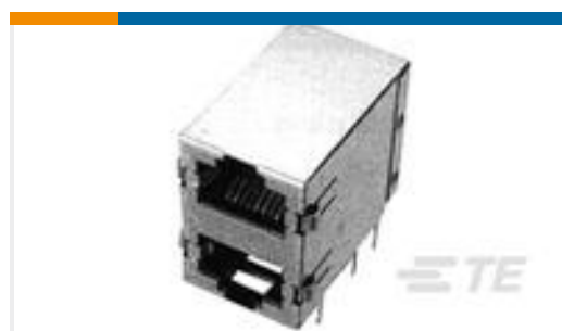
TE 系列/零件编号5569381-1 STK MJ ASSY,8POS,2X1,SHLD,CAT5