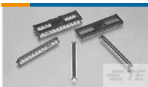
TE 系列/零件编号3-5353652-6 .5FHP08H,440,B,GIG,08/Sn,HT,NSYes