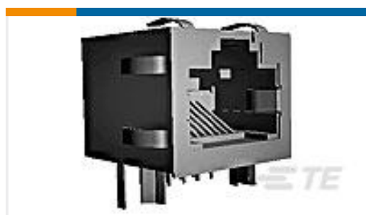
TE 系列/零件编号1-406541-1 MJ,INV,1X1,6PNL G,.100" ST,SN