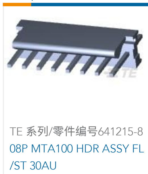
TE 系列/零件编号641215-8 08P MTA100 HDR ASSY FL /ST 30AU