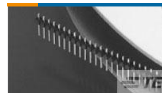
TE 系列/零件编号146858-1 B/A REELED SRST HDR ASSY 15 AU