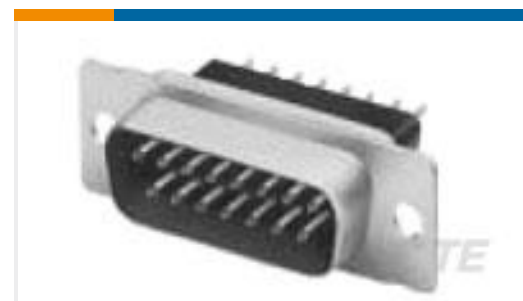
TE 系列/零件编号5749014-1 9 PLUG W/INDENTS & C NUTS