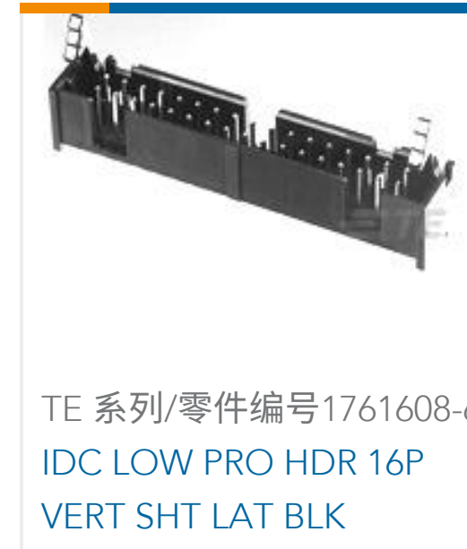
TE 系列/零件编号1761608-6 IDC LOW PRO HDR 16P VERT SHT LAT BLK