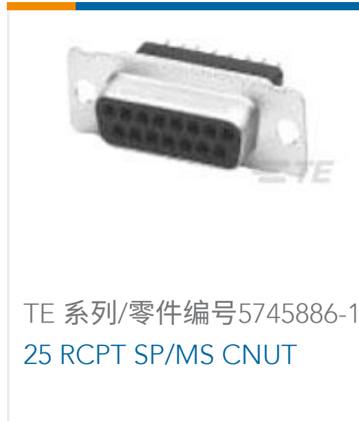
TE 系列/零件编号5745886-1 25 RCPT SP/MS CNUT