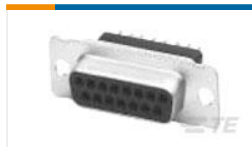
TE 系列/零件编号747190-2 09 RCPT SP/MS CNUT