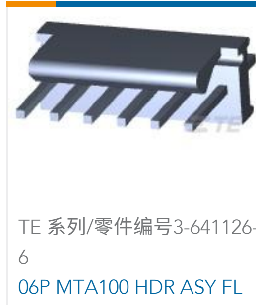
TE 系列/零件编号3-641126-6 06P MTA100 HDR ASY FL /STR LF