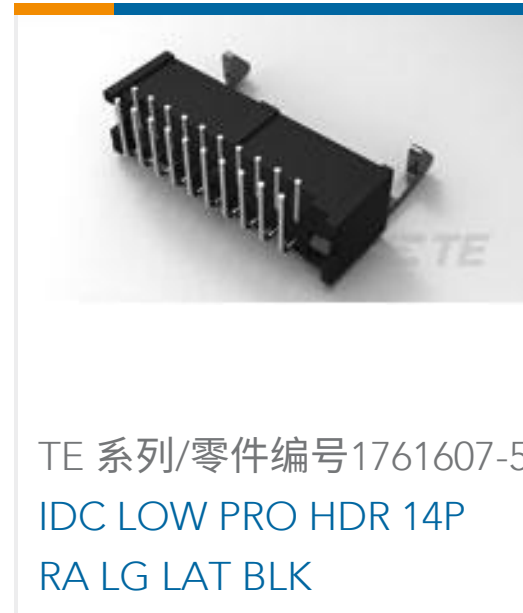
TE 系列/零件编号1761607-5 IDC LOW PRO HDR 14P RA LG LAT BLK