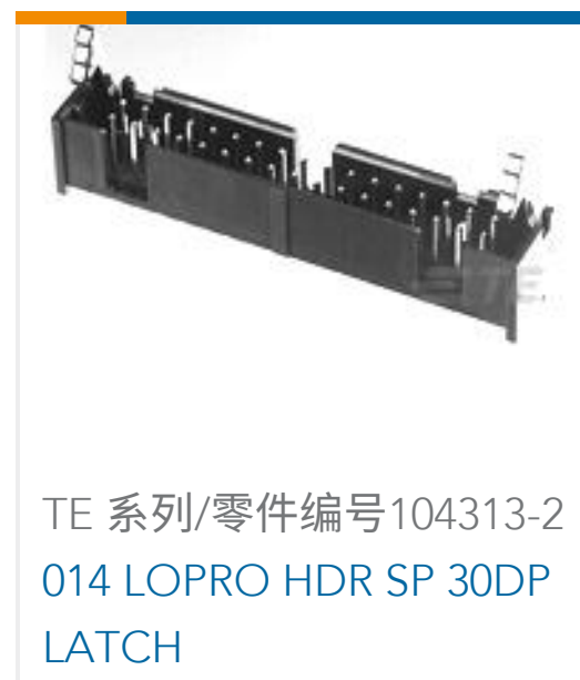
TE 系列/零件编号104313-2 014 LOPRO HDR SP 30DP LATCH