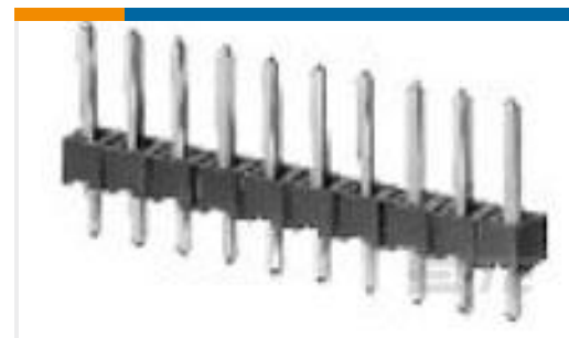
TE 系列/零件编号9-146278-0 40 MODII HDR SRST B/A . 100CL