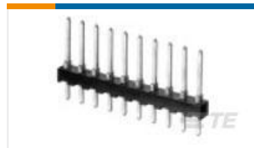
TE 系列/零件编号87220-3 03 MODII HDR SRST UNSHRD .100