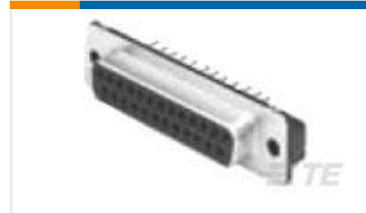
TE 系列/零件编号5747150-2 09 RCPT SP/FMS STD