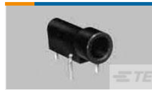
TE 系列/零件编号350180 TEST PROBE ASSEMBLY REC PA66 NATURAL