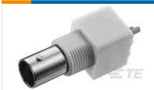
TE 系列/零件编号5227222-1 VERT JK W/MTG PINS, BNC PCB