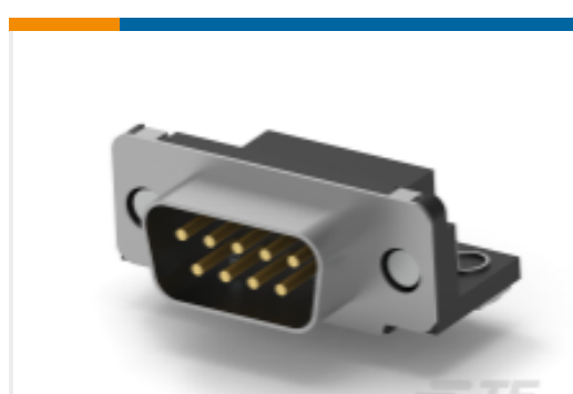
TE 系列/零件编号 5747250-3 09 MSFL PLUG RA 318 (IN, FM)