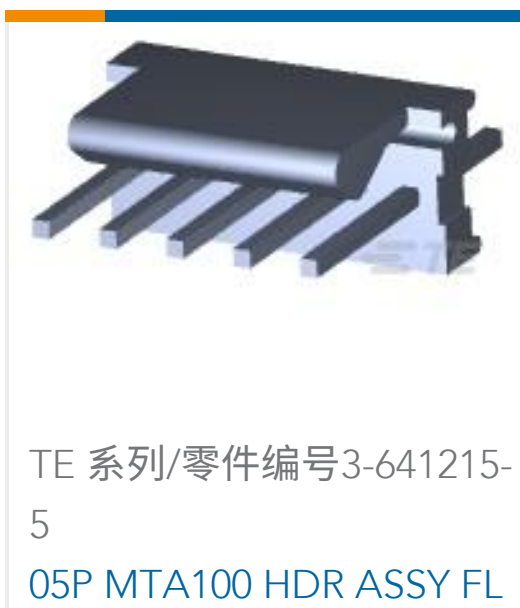
TE 系列/零件编号3-641215- 5 05P MTA100 HDR ASSY FL 30AU LF