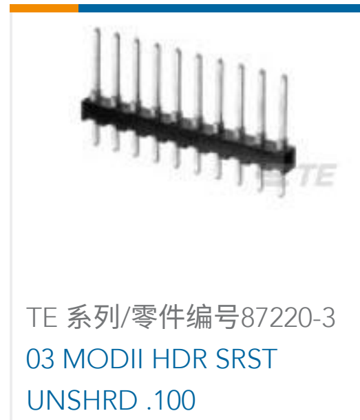
TE 系列/零件编号87220-3 03 MODII HDR SRST UNSHRD .100