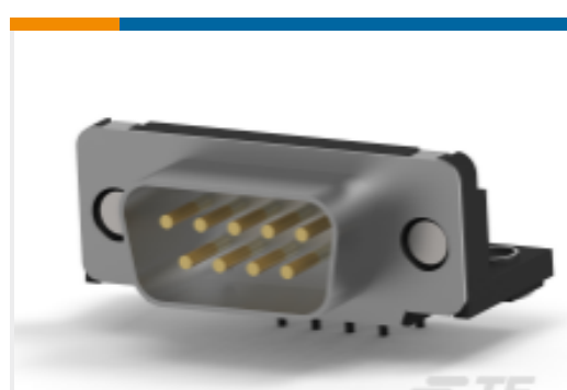
TE 系列/零件编号 5747250-4 09 MSFL PLUG RA 318 (IN, FM)