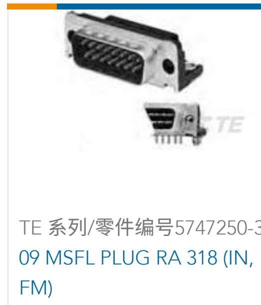
TE 系列/零件编号5747250-3 09 MSFL PLUG RA 318 (IN, FM)