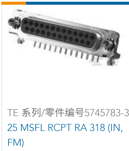
TE 系列/零件编号5745783-3 25 MSFL RCPT RA 318 (IN, FM)