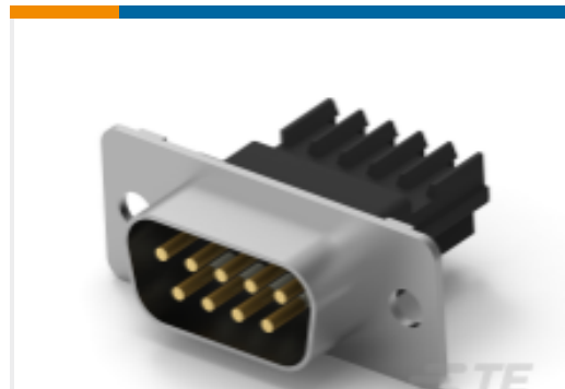
TE 系列/零件编号 2-745492-0 PLUG ASSY,9P,HDE,MS