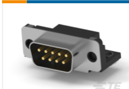
TE 系列/零件编号 5747250-2 09 MSFL PLUG RA 318 (FM)