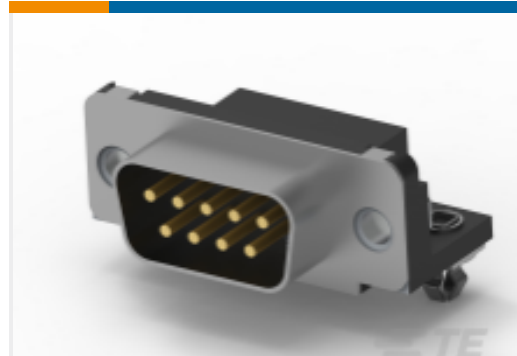
TE 系列/零件编号 5788792-2 09 HTMSFL PLUG RA 318 (IN,BL)