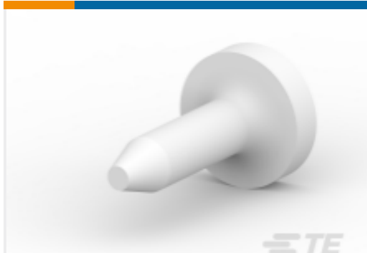
TE 系列/零件编号 206509-1 SIZE 20 KEYING PLUG