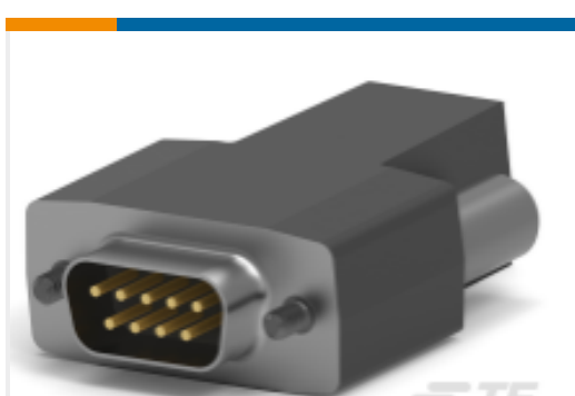
TE 系列/零件编号 1-747944-6 KIT,PLUG,9P,HDE,SHLD ENCLSRE