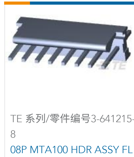
TE 系列/零件编号3-641215- 8 08P MTA100 HDR ASSY FL /ST 30AU