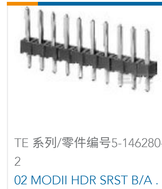
TE 系列/零件编号5-146280- 2 02 MODII HDR SRST B/A . 100CL