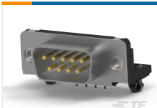
TE 系列/零件编号 5788792-1 09 HTMSFL PLUG RA 318 (IN,BL)