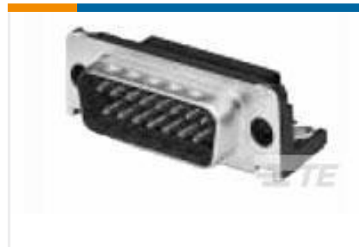
TE 系列/零件编号 5788793-2 09 HTMSFL PLUG RA 318 (SL,BL)