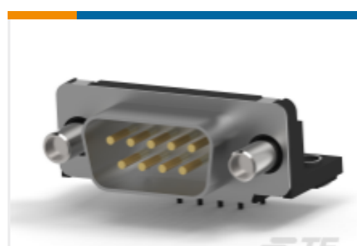
TE 系列/零件编号 5747250-6 09 MSFL PLUG RA 318 (SL, FM)