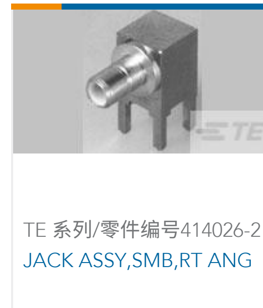
TE 系列/零件编号414026-2 JACK ASSY,SMB,RT ANG