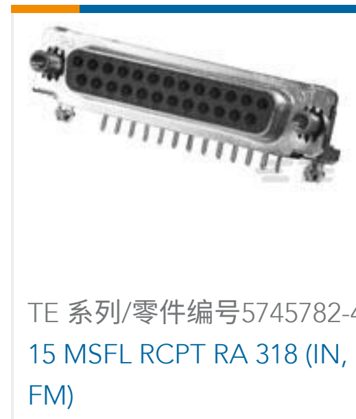
TE 系列/零件编号5745782-4 15 MSFL RCPT RA 318 (IN, FM)