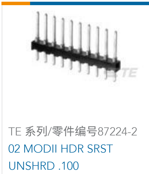
TE 系列/零件编号87224-2 02 MODII HDR SRST UNSHRD .100