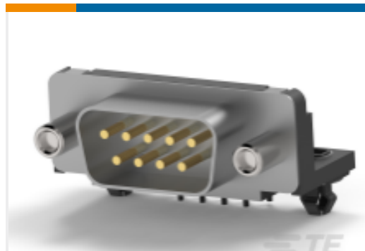
TE 系列/零件编号 5788793-1 09 HTMSFL PLUG RA 318 (SL,BL)