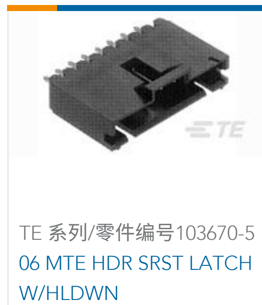
TE 系列/零件编号103670-5 06 MTE HDR SRST LATCH W/HLDWN