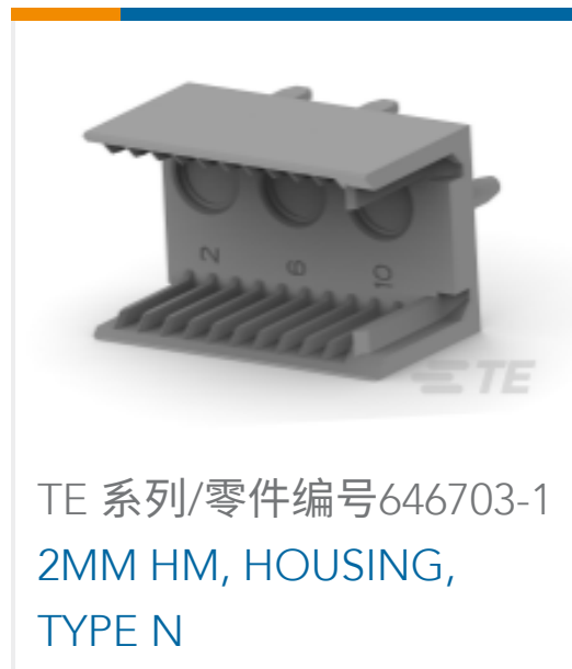
TE 系列/零件编号646703-1 2MM HM, HOUSING, TYPE N