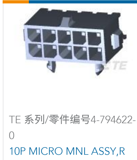
TE 系列/零件编号4-794622-0 10P MICRO MNL ASSY,R /A,SMT LF