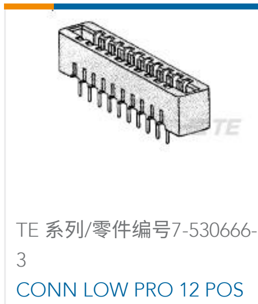
TE 系列/零件编号7-530666-3 CONN LOW PRO 12 POS 156X200C/