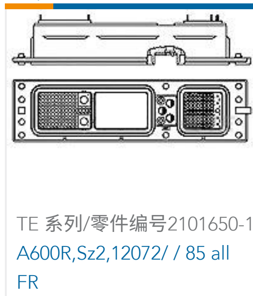
TE 系列/零件编号2101650-1 A600R,Sz2,12072/ / 85 all FR