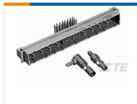
TE 系列/零件编号 148411-5 EURO TYPE M PIN ASSY 78+2