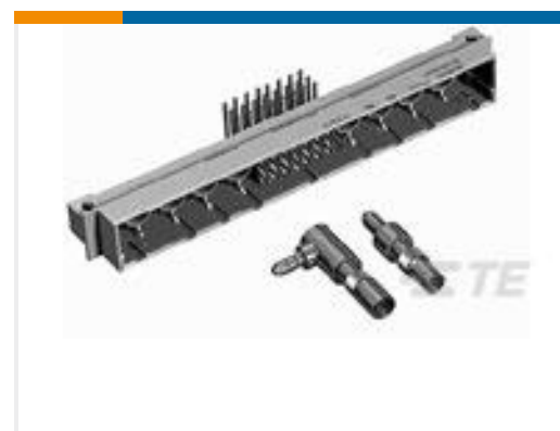
TE 系列/零件编号 5148411-5 ASSY,PIN,R.A.,TYPE M, EUROCARD,L-FREE,78+