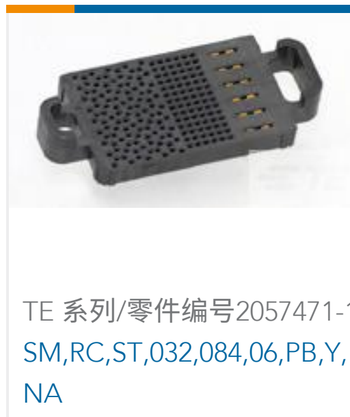
TE 系列/零件编号2057471-1 SM,RC,ST,032,084,06,PB,Y, NA