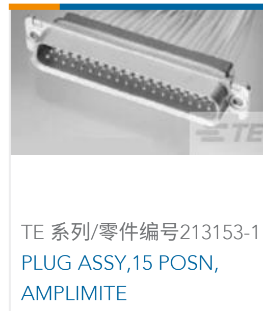
TE 系列/零件编号213153-1 PLUG ASSY,15 POSN, AMPLIMITE