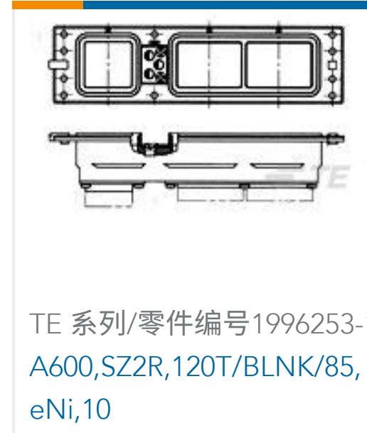
TE 系列/零件编号1996253-1 A600,SZ2R,120T/BLNK/85, eNi,10