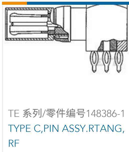
TE 系列/零件编号148386-1 TYPE C,PIN ASSY.RTANG, RF