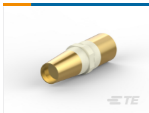
TE 系列/零件编号 148375-1 EURO, TYPE M CONTACT, FEMALE