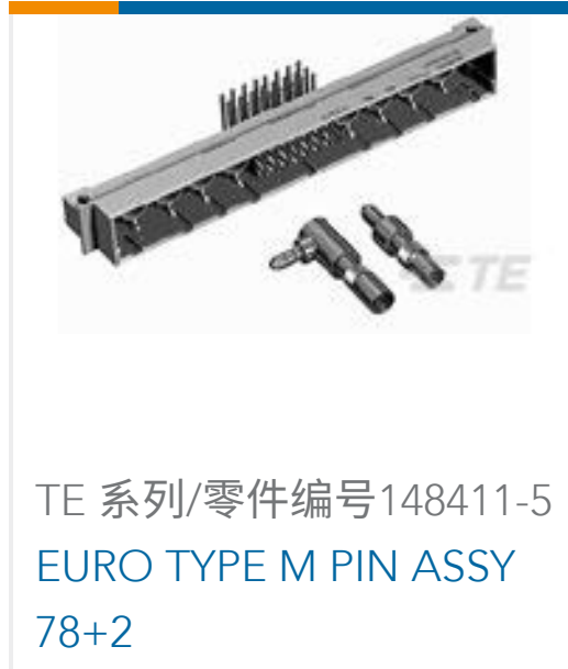
TE 系列/零件编号148411-5 EURO TYPE M PIN ASSY 78+2