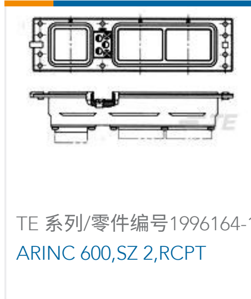
TE 系列/零件编号1996164-1 ARINC 600,SZ 2,RCPT