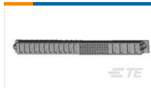
TE 系列/零件编号6450863-5 MBXLE VERT RCPT 7ACP