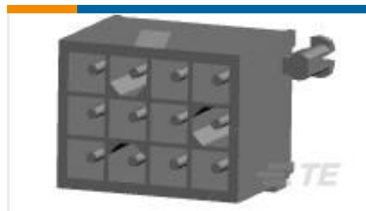
TE 系列/零件编号1-770186-1 12P MINI UMNL ASSY VO SNAU LF