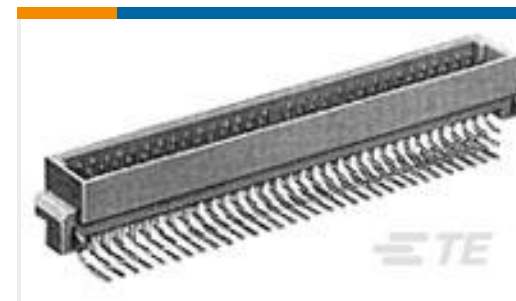
TE 系列/零件编号650945-5 064 EURO TYPE C PIN ST ASSY