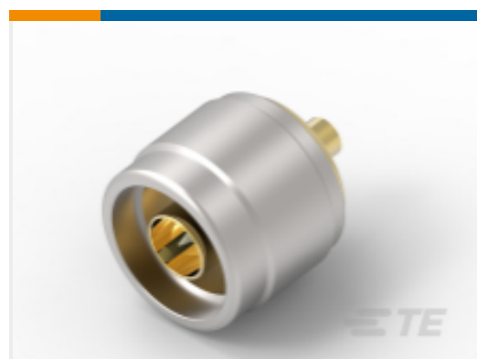
TE 系列/零件编号 1057088-1 3001 7941 00