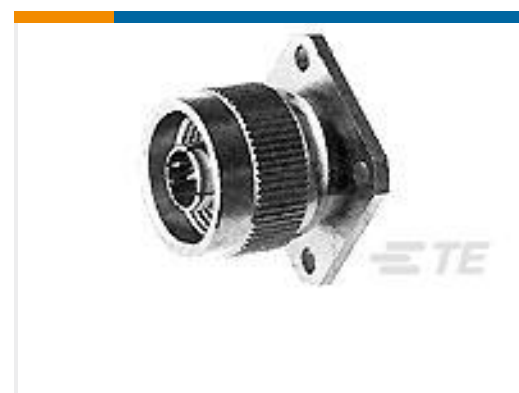
TE 系列/零件编号 1057279-1 3051 1201 10