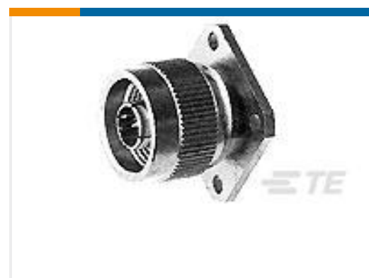
TE 系列/零件编号 1057275-1 3051 0000 10