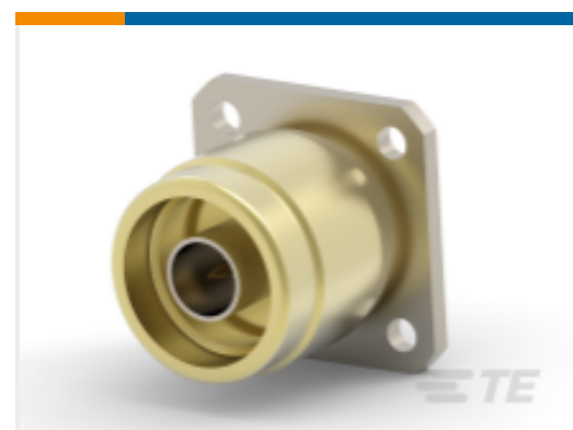
TE 系列/零件编号 1057277-1 3051 1200 10