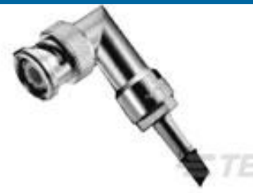
TE 系列/零件编号 5225974-1 PLUG, RT ANGLE, DUAL CRIMP BNC