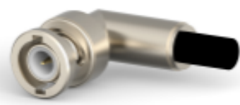
TE 系列/零件编号 5221128-1 PLUG,COMMERCIAL BNC