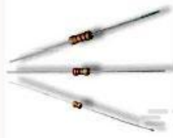
TE 系列/零件编号1-1337418-0 N Pnl Skt 50Ohm Silver Pltd