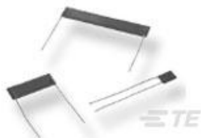
TE 系列/零件编号1624216-2 23SE 4K7B 6.35X50FL B7 CAT