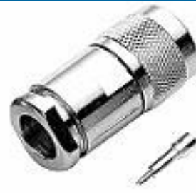
TE 系列/零件编号1-1337624-0 N Str Adp JJ 50Ohm Nickel Pltd