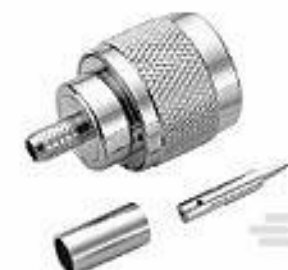
TE 系列/零件编号4-6437630-0 FTD59G04=LOCKING TOGGLE