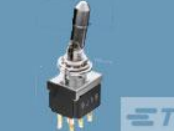
TE 系列/零件编号5-1623930-4 CFR25 5% 220R