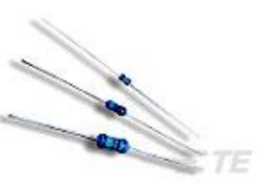
TE 系列/零件编号2-1625959-5 HB03RE 50M 1% 100PPM