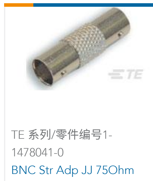
TE 系列/零件编号1-1478041-0 BNC Str Adp JJ 75Ohm Silver Pltd