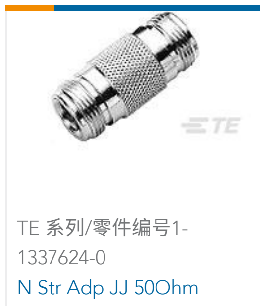
TE 系列/零件编号1-1337624-0 N Str Adp JJ 50Ohm Nickel Pltd