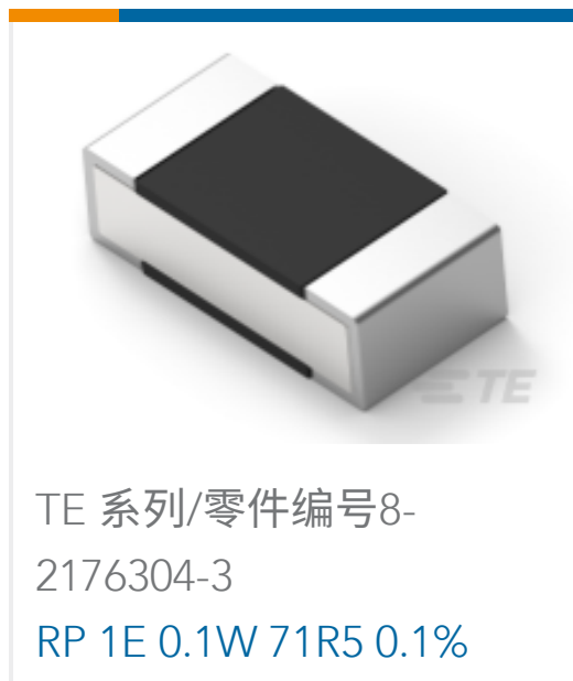
TE 系列/零件编号8- 2176304-3 RP 1E 0.1W 71R5 0.1% 25PPM 5K RL