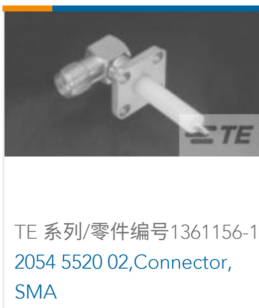
TE 系列/零件编号1361156-1 2054 5520 02,Connector, SMA