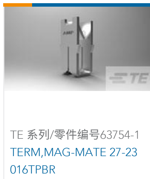
TE 系列/零件编号63754-1 TERM,MAG-MATE 27-23 016TPBR