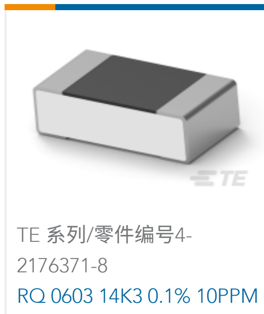
TE 系列/零件编号4- 2176371-8 RQ 0603 14K3 0.1% 10PPM 5K RL