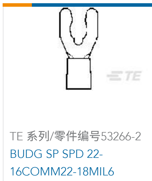
TE 系列/零件编号53266-2 BUDG SP SPD 22- 16COMM22-18MIL6