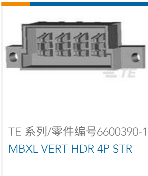
TE 系列/零件编号6600390-1 MBXL VERT HDR 4P STR