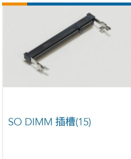
SO DIMM 插槽(15)