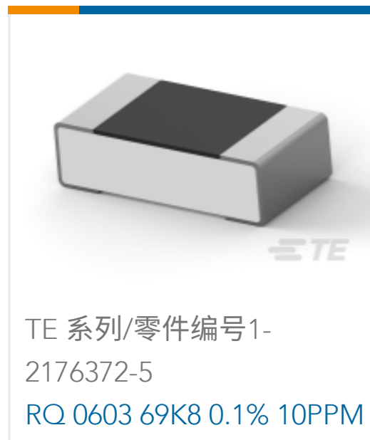
TE 系列/零件编号1- 2176372-5 RQ 0603 69K8 0.1% 10PPM 5K RL