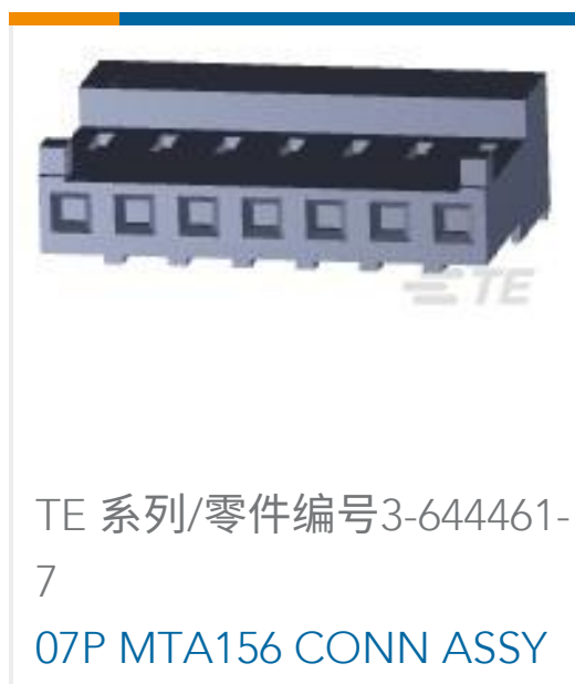
TE 系列/零件编号3-644461- 7 07P MTA156 CONN ASSY 18AWG LF