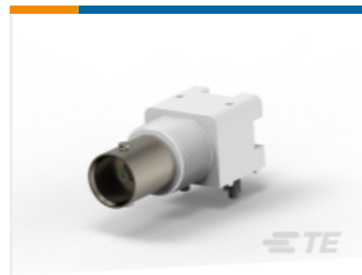
TE 系列/零件编号 5413194-1 BNC, RT ANG, PCB, JACK