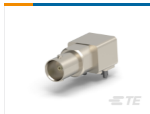
TE 系列/零件编号 5414907-1 JACK,PCB,75 OHM,NC