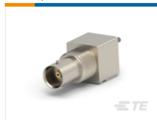
TE 系列/零件编号 5222132-1 JACK,VERTICAL,PCB,75 OHM,BNC