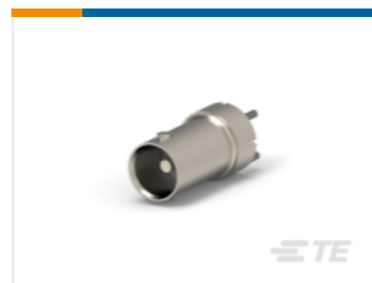
TE 系列/零件编号 6274291-2 JACK,VERT,PCB,75OHM, BNC