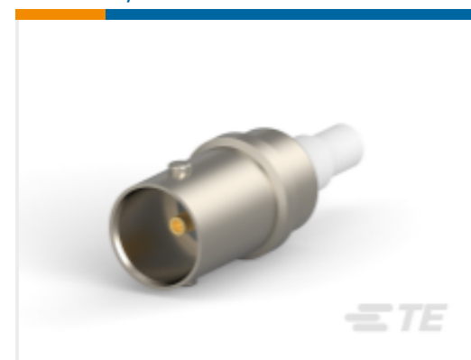
TE 系列/零件编号 5221199-5 JACK,75 OHM COML BNC