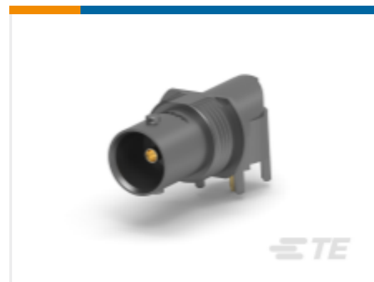
TE 系列/零件编号 6274425-2 JACK,R/A,PCB,75 OHM, BNC