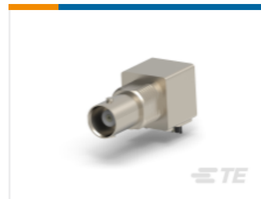
TE 系列/零件编号 5222092-3 JACK,RTANG,PCB,75 OHM,BNC