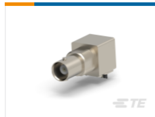
TE 系列/零件编号 5222092-1 JACK,RTANG,PCB,75 OHM,BNC