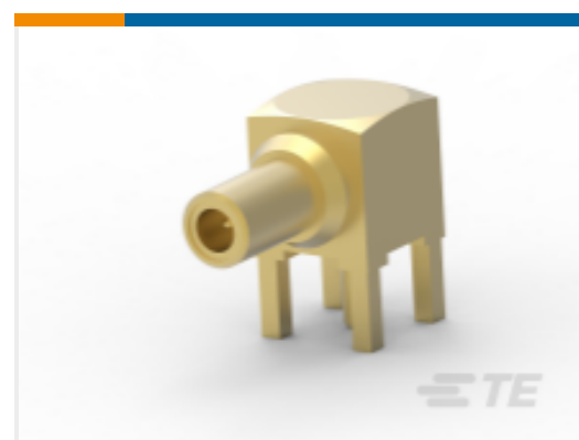
TE 系列/零件编号 1-1337481-0 SMB R/A PCB Skt 50Ohm Gold Plt