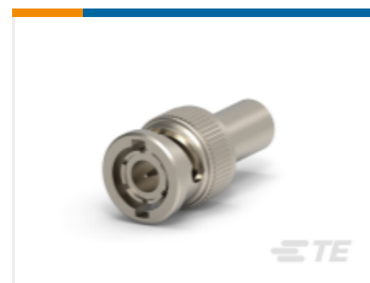
TE 系列/零件编号 1-5221128-0 PLUG,COMMERCIAL BNC