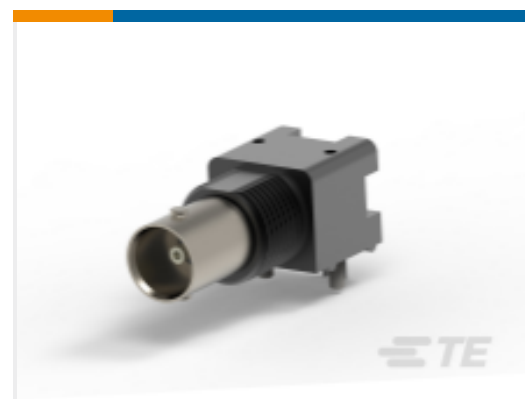
TE 系列/零件编号 5413194-2 BNC, RT ANG, PCB, JACK