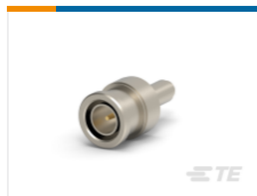
TE 系列/零件编号 5413589-8 KIT,PLUG,COML BNC,HEX CRP