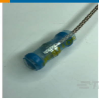
TE 系列/零件编号650335-000 SO63-1-55-20-5