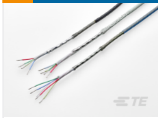
TE 系列/零件编号EK0442-000 THX-26C422-814-0