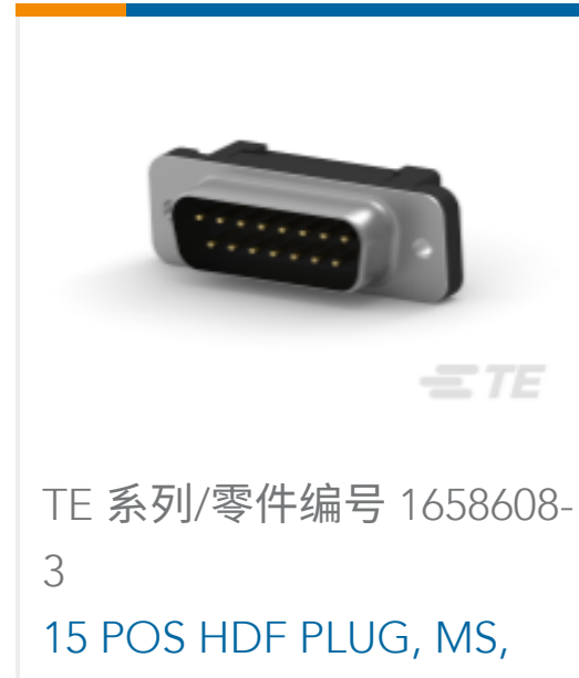
TE 系列/零件编号 1658608-3 15 POS HDF PLUG, MS, LEAD FREE