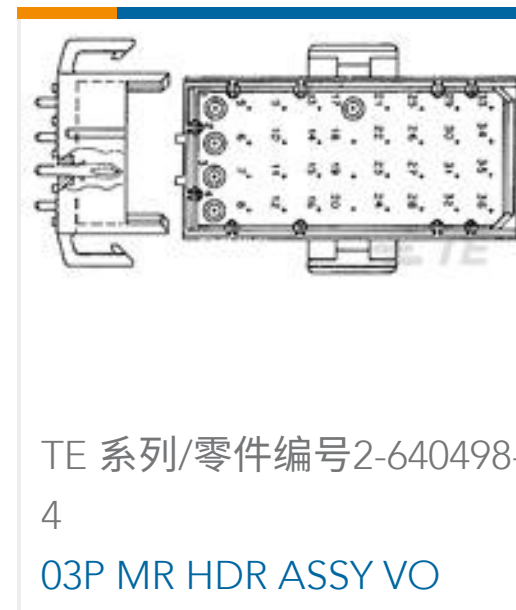
TE 系列/零件编号2-640498-4 03P MR HDR ASSY VO RED LF