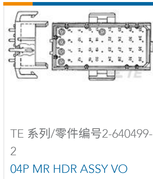
TE 系列/零件编号2-640499-2 04P MR HDR ASSY VO RED LF