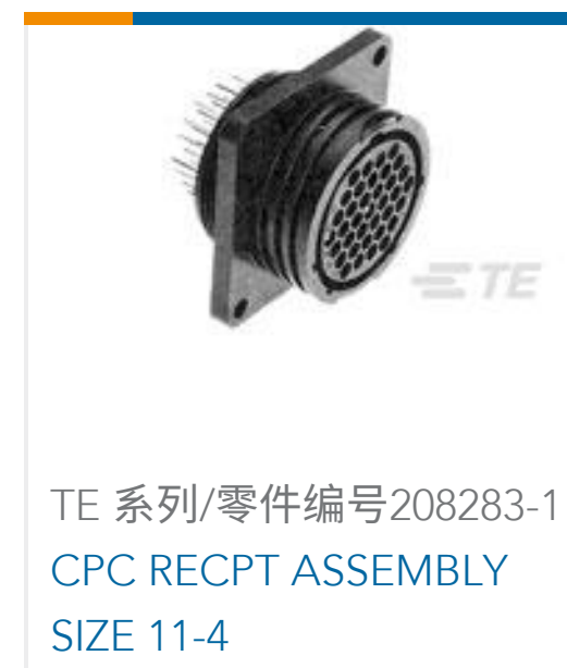
TE 系列/零件编号 208283-1 CPC RECPT ASSEMBLY SIZE 11-4