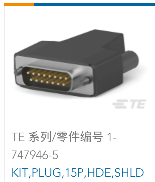
TE 系列/零件编号 1-747946-5 KIT, PLUG, 15P, HDE, SHLD ENCLSRE