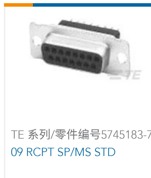
TE 系列/零件编号 5745183-7 09 RCPT SP/MS STD