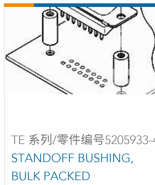
TE 系列/零件编号 5205933-4 STANDOFF BUSHING, BULK PACKED