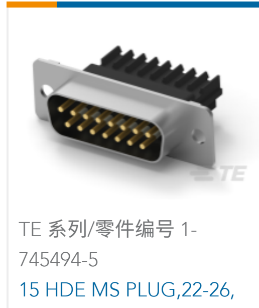
TE 系列/零件编号 1-745494-5 15 HDE MS PLUG, 22-26, LEAD FREE