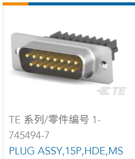
TE 系列/零件编号 1-745494-7 PLUG ASSY, 15P, HDE, MS