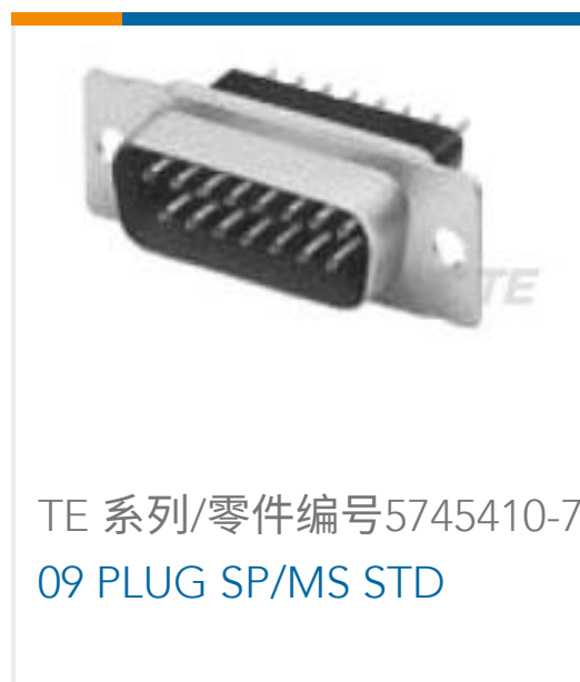
TE 系列/零件编号 5745410-7 09 PLUG SP/MS STD