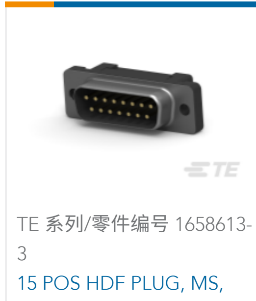
TE 系列/零件编号 1658613-3 15 POS HDF PLUG, MS, LEAD FREE