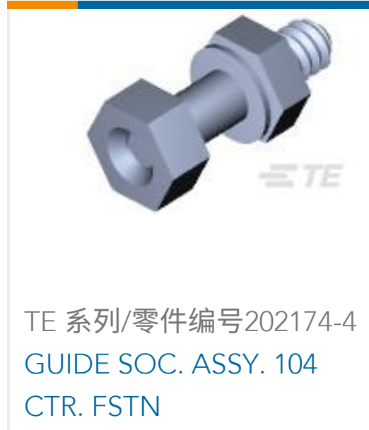
TE 系列/零件编号202174-4 GUIDE SOC. ASSY. 104 CTR. FSTN