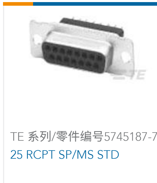
TE 系列/零件编号5745187-7 25 RCPT SP/MS STD