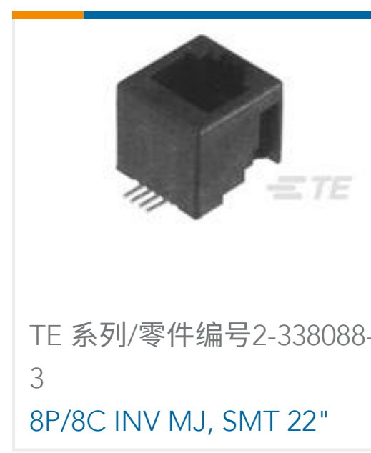
TE 系列/零件编号2-338088-3 8P/8C INV MJ, SMT 22" TOP REEL