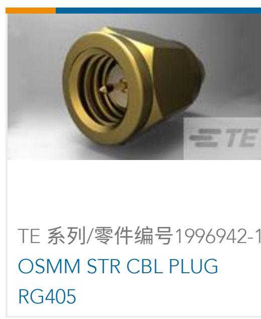
TE 系列/零件编号1996942-1 OSMM STR CBL PLUG RG405