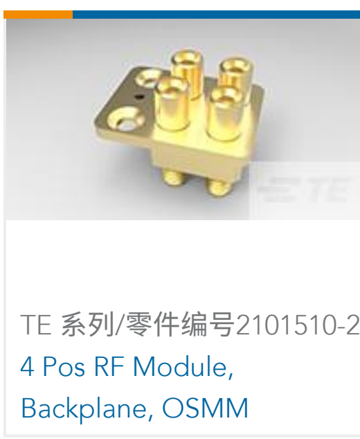
TE 系列/零件编号2101510-2 4 Pos RF Module, Backplane, OSMM PASSIVA