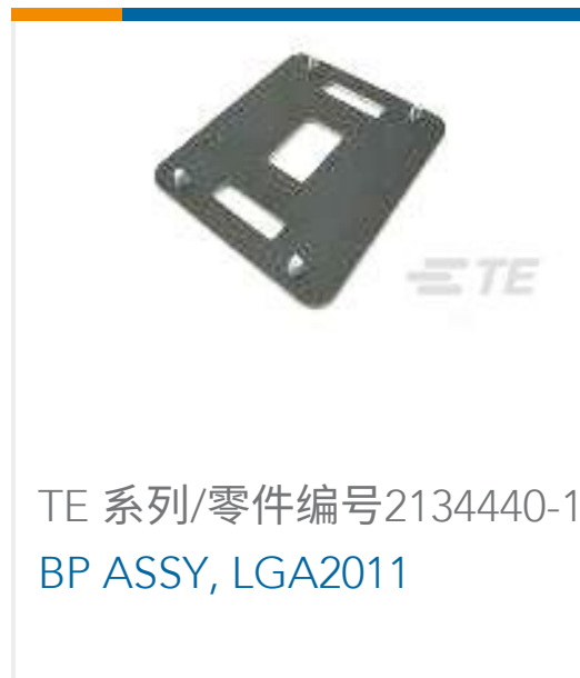
TE 系列/零件编号2134440-1 BP ASSY, LGA2011