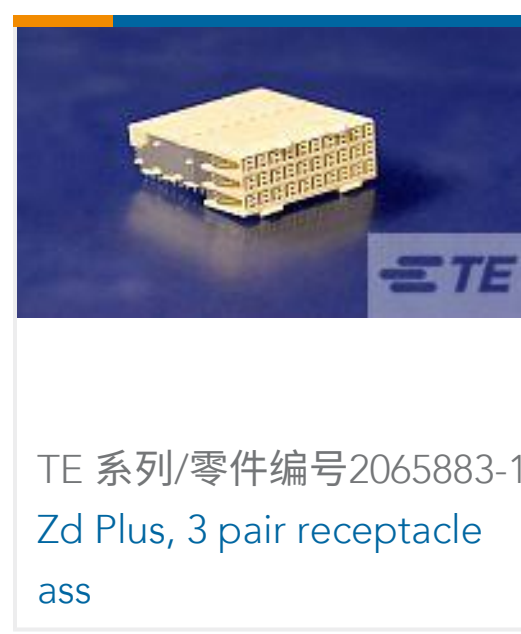
TE 系列/零件编号2065883-1 Zd Plus, 3 pair receptacle ass