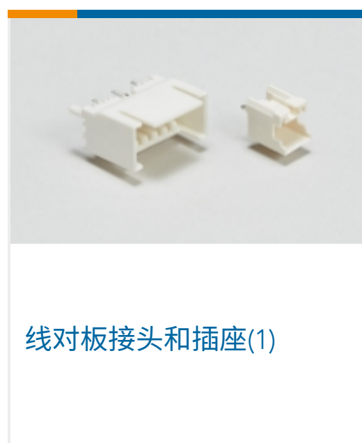
线对板接头和插座(1)