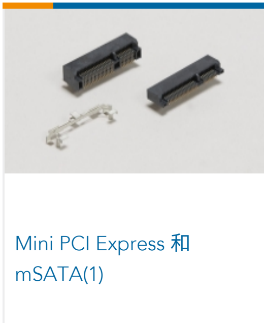
Mini PCI Express 和 mSATA(1)