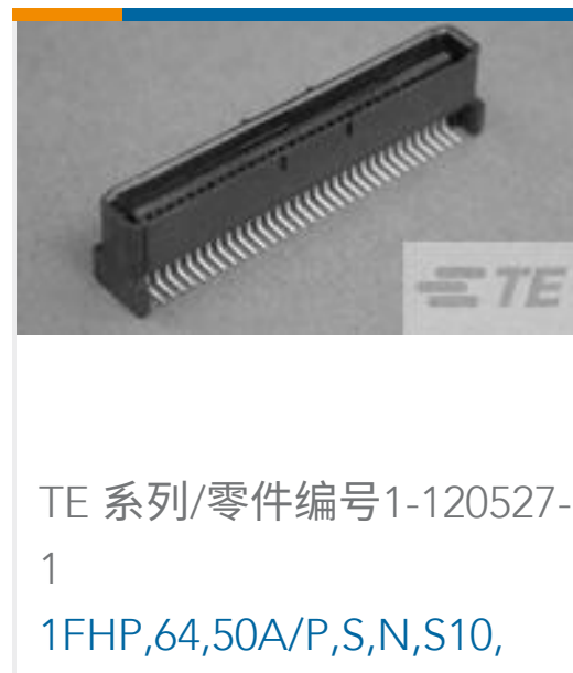
TE 系列/零件编号1-120527-1 1FHP,64,50A/P,S,N,S10, 12,13,15