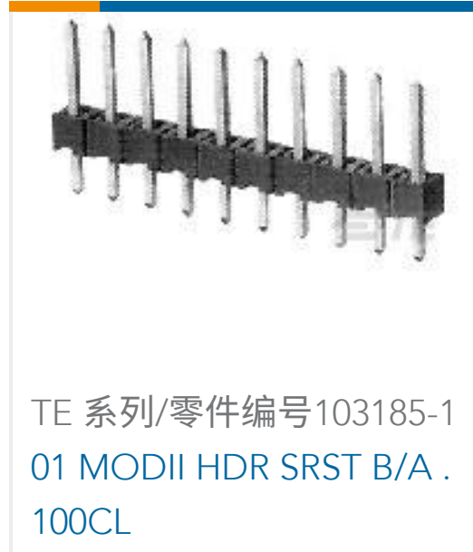
TE 系列/零件编号103185-1 01 MODII HDR SRST B/A . 100CL