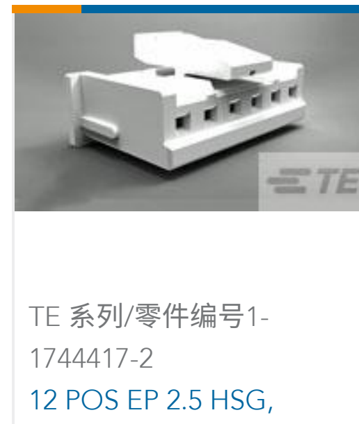
TE 系列/零件编号1-1744417-2 12 POS EP 2.5 HSG, GLOW WIRE