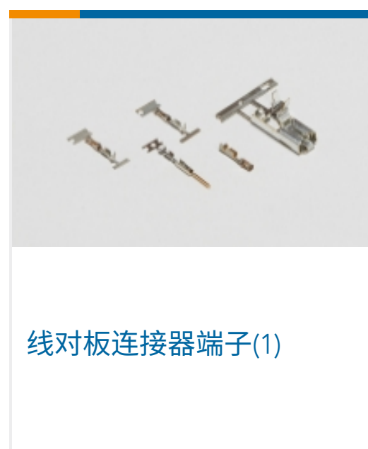
线对板连接器端子(1)