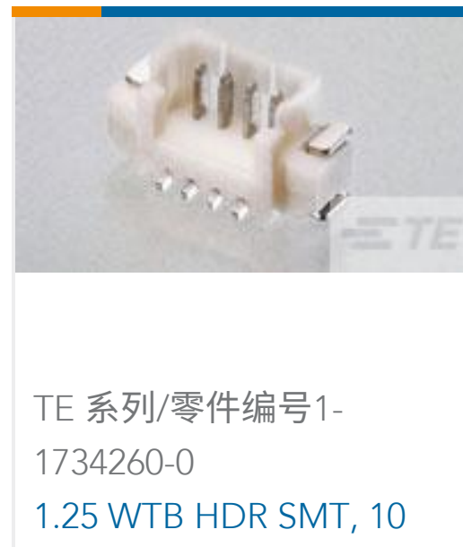
TE 系列/零件编号1-1734260-0 1.25 WTB HDR SMT, 10 POS