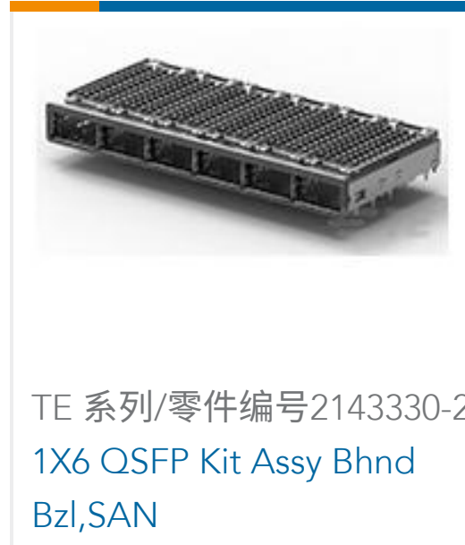
TE 系列/零件编号2143330-2 1X6 QSFP Kit Assy Bhnd Bzl,SAN