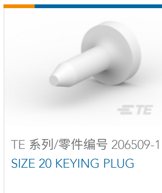
TE 系列/零件编号 206509-1 SIZE 20 KEYING PLUG