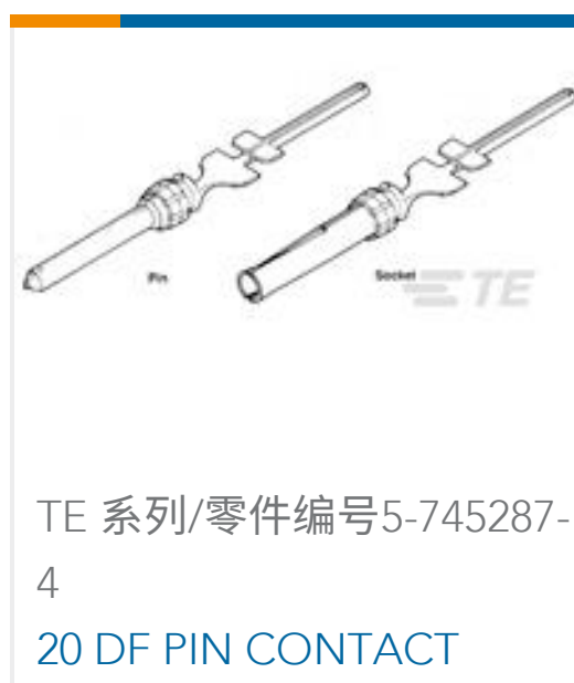
TE 系列/零件编号 5-745287-4 20 DF PIN CONTACT DUPLEX/LP