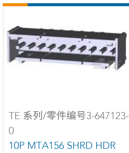
TE 系列/零件编号 3-647123-0 10P MTA156 SHRD HDR ASSY SQ SN