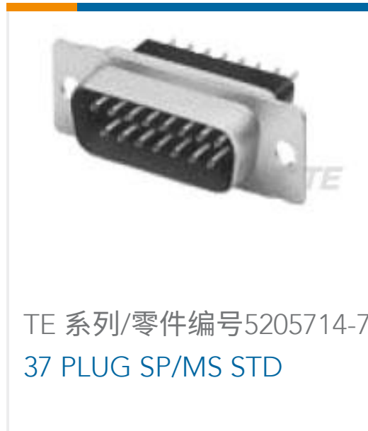
TE 系列/零件编号 5205714-7 37 PLUG SP/MS STD