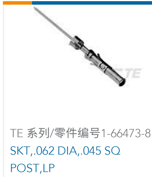
TE 系列/零件编号 1-66473-8 SKT, .062 DIA, .045 SQ POST, LP