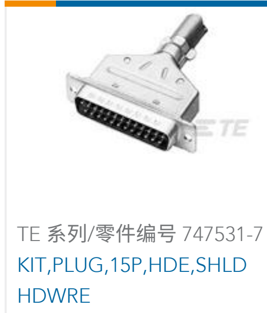
TE 系列/零件编号 747531-7 KIT, PLUG, 15P, HDE, SHLD HDWRE