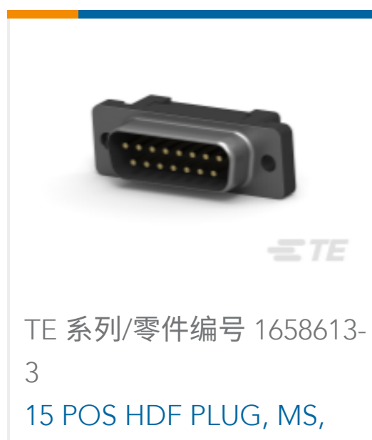
TE 系列/零件编号 1658613-3 15 POS HDF PLUG, MS, LEAD FREE