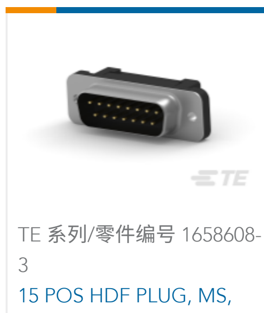
TE 系列/零件编号 1658608-3 15 POS HDF PLUG, MS, LEAD FREE