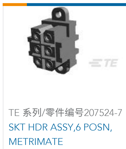
TE 系列/零件编号 207524-7 SKT HDR ASSY, 6 POSN, METRIMATE