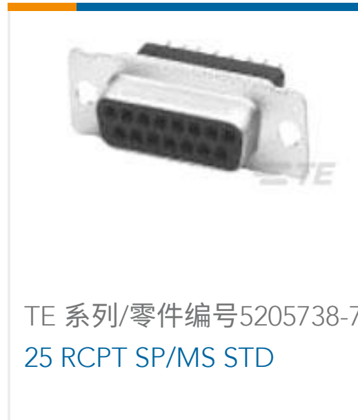
TE 系列/零件编号 5205738-7 25 RCPT SP/MS STD