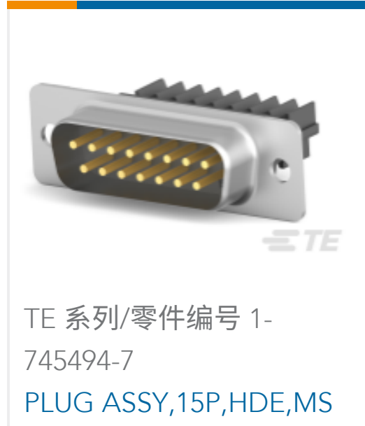
TE 系列/零件编号 1-745494-7 PLUG ASSY, 15P, HDE, MS