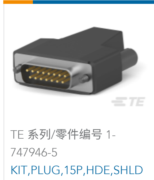
TE 系列/零件编号 1-747946-5 KIT, PLUG, 15P, HDE, SHLD ENCLSRE