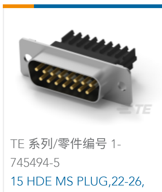
TE 系列/零件编号 1-745494-5 15 HDE MS PLUG, 22-26, LEAD FREE