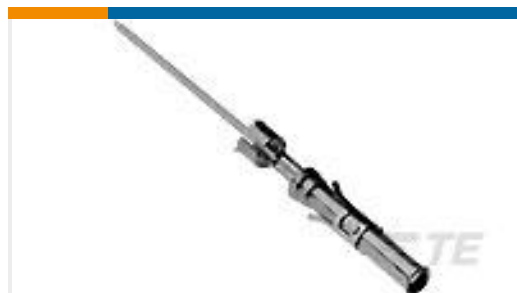
TE 系列/零件编号66461-7 SKT,.062 DIA,.025 SQ POST,LP