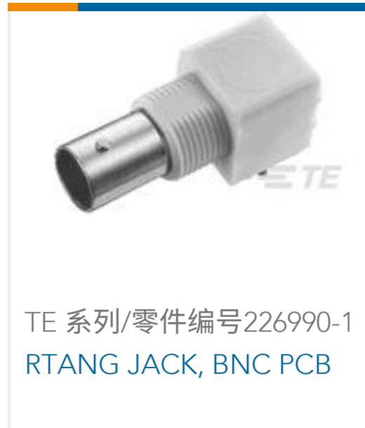
TE 系列/零件编号 226990-1 RTANG JACK, BNC PCB