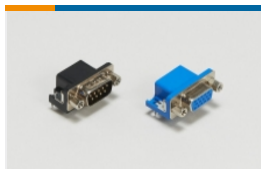
PCB D-Sub 连接器(353)