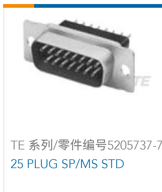
TE 系列/零件编号 5205737-7 25 PLUG SP/MS STD