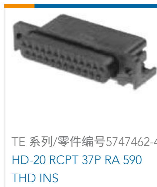
TE 系列/零件编号 5747462-4 HD-20 RCPT 37P RA 590 THD INS