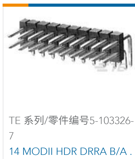
TE 系列/零件编号 5-103326-7 14 MODII HDR DRRA B/A . 100CL