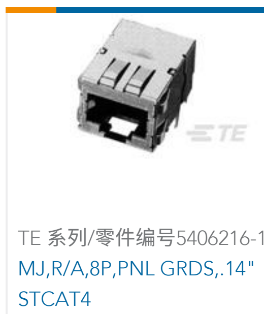
TE 系列/零件编号 5406216-1 MJ, R/A, 8P, PNL GRDS, .14" STCAT4