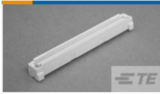
TE 系列/零件编号6-5177986-2 0.8FH,P06H.5,060,30/Sn,TR,SC