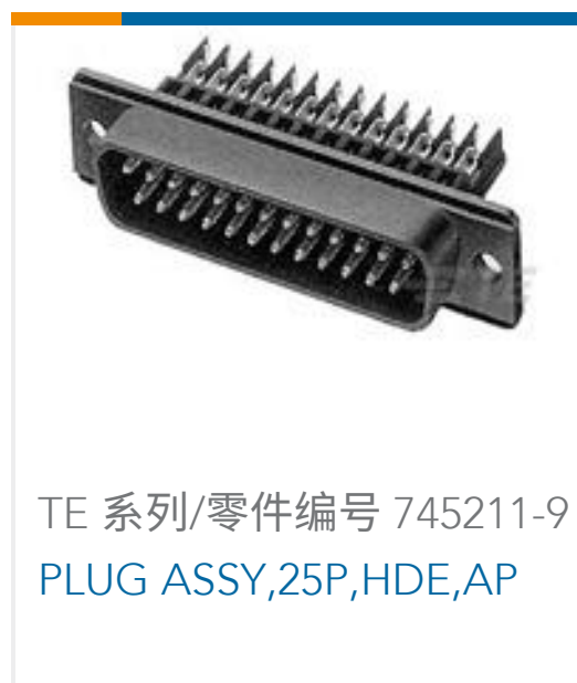
TE 系列/零件编号 745211-9 PLUG ASSY, 25P, HDE, AP