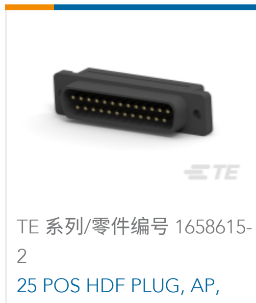
TE 系列/零件编号 1658615-2 25 POS HDF PLUG, AP, LEAD FREE