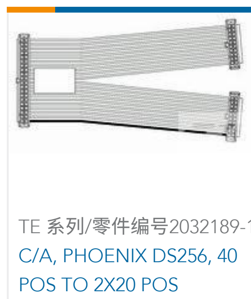
TE 系列/零件编号 2032189-1 C/A, PHOENIX DS256, 40 POS TO 2X20 POS