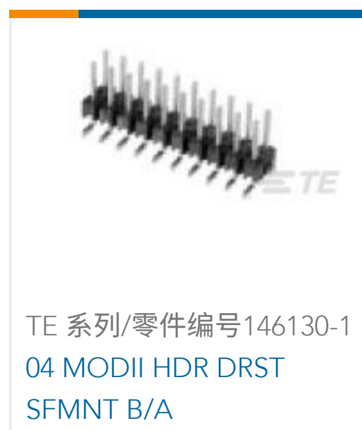
TE 系列/零件编号 146130-1 04 MODII HDR DRST SFMNT B/A