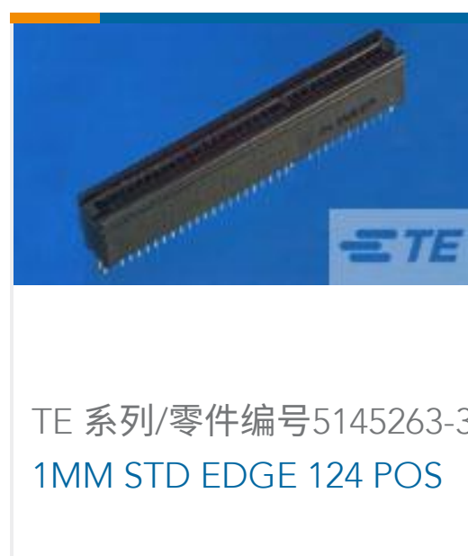
TE 系列/零件编号 5145263-3 1MM STD EDGE 124 POS