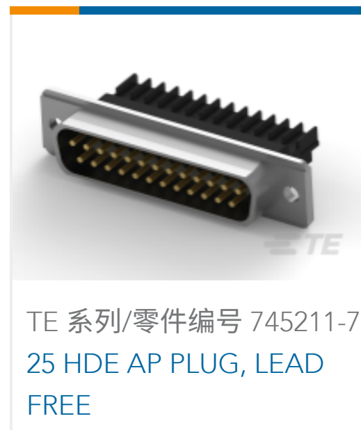
TE 系列/零件编号 745211-7 25 HDE AP PLUG, LEAD FREE