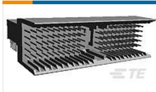
TE 系列/零件编号6345051-1 Z-PACK/A RAMH.110P.