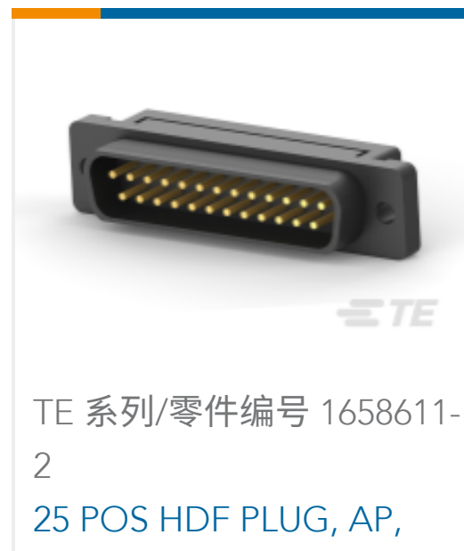
TE 系列/零件编号 1658611-2 25 POS HDF PLUG, AP, LEAD FREE