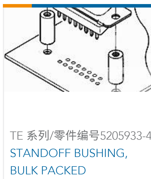
TE 系列/零件编号 5205933-4 STANDOFF BUSHING, BULK PACKED