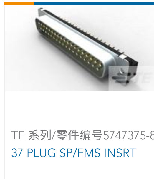
TE 系列/零件编号5747375-8 37 PLUG SP/FMS INSRT