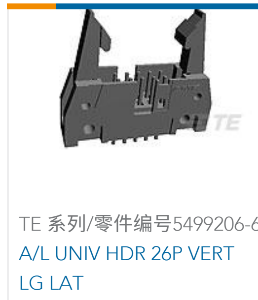
TE 系列/零件编号5499206-6 A/L UNIV HDR 26P VERT LG LAT