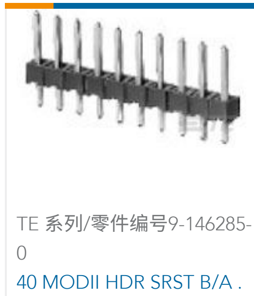
TE 系列/零件编号9-146285-0 40 MODII HDR SRST B/A . 100CL