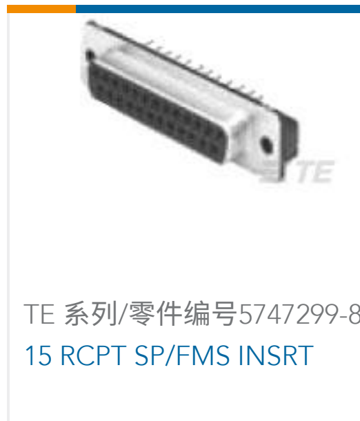
TE 系列/零件编号5747299-8 15 RCPT SP/FMS INSRT