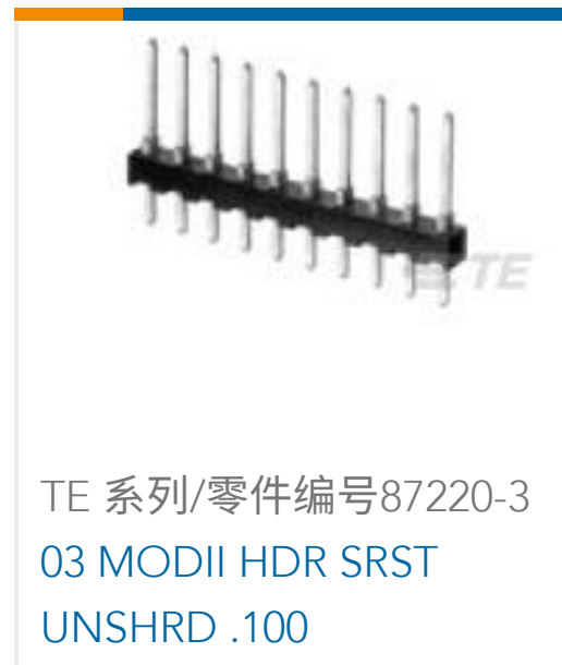
TE 系列/零件编号87220-3 03 MODII HDR SRST UNSHRD .100