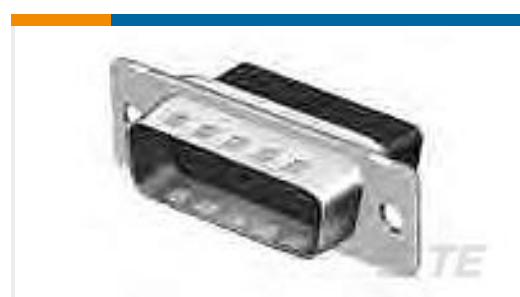
TE 系列/零件编号205206-8 HDP-20, PLUG, SIZE 2, 15 POSN