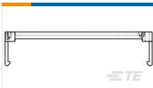
TE 系列/零件编号747275-4 009 LP HDF STRAIN RELIEF