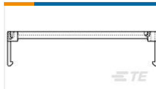
TE 系列/零件编号747275-3 015 LP HDF STRAIN RELIEF