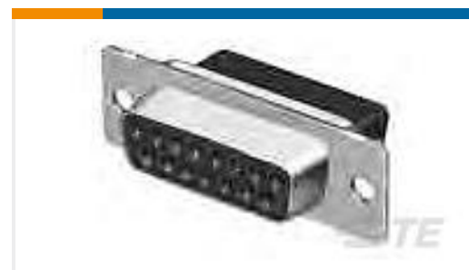
TE 系列/零件编号1658644-1 HDP-20, RCPT, SIZE 2, 15 POSN, CL