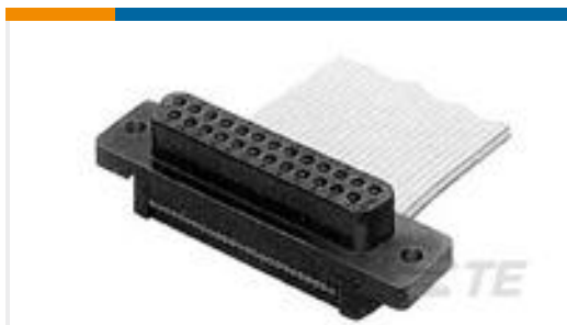
TE 系列/零件编号1658614-2 25 POS HDF RCPT, AP, LEAD FREE