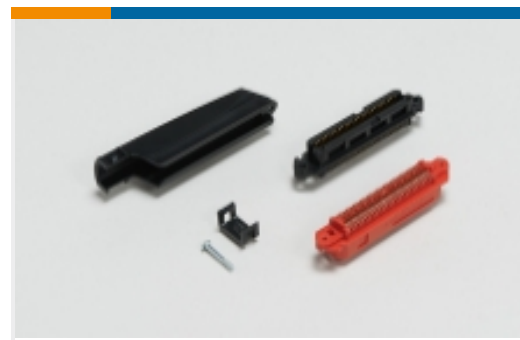
IDC D-Sub 连接器(36)