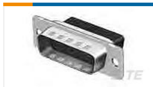
TE 系列/零件编号1658642-1 HDP-20, PLUG, SIZE 1, 9 POSN, CLI