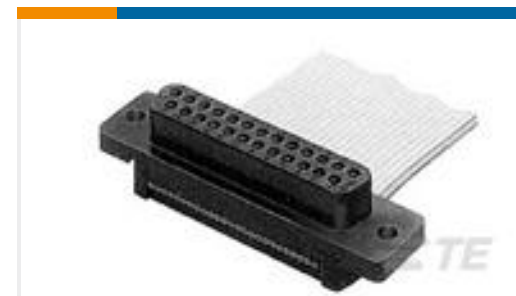
TE 系列/零件编号1658614-4 09 POS HDF RCPT, AP, LEAD FREE