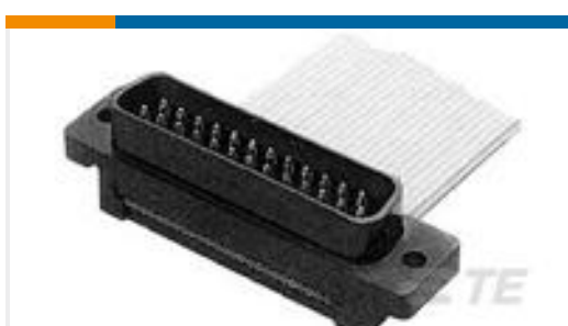
TE 系列/零件编号1658615-3 15 POS HDF PLUG, AP, LEAD FREE