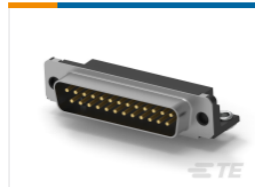
TE 系列/零件编号 5747238-2 25 MSFL PLUG RA 318 (FM)