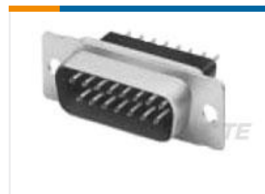
TE 系列/零件编号 5745412-7 25 PLUG SP/MS STD