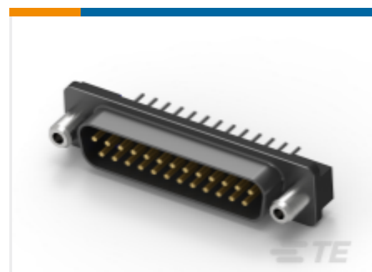
TE 系列/零件编号 1-5745968-6 25 PLUG SP/FMS SCRLK