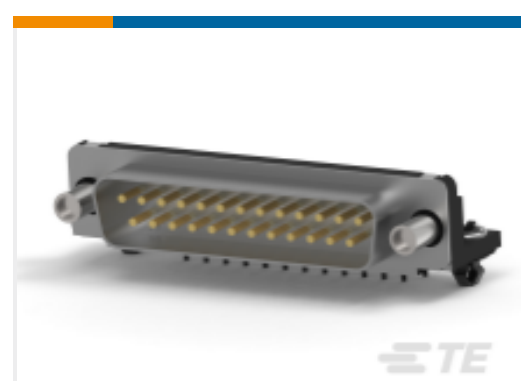
TE 系列/零件编号 5747842-6 25 MSFL PLUG RA 318 (SL, FM,BL)