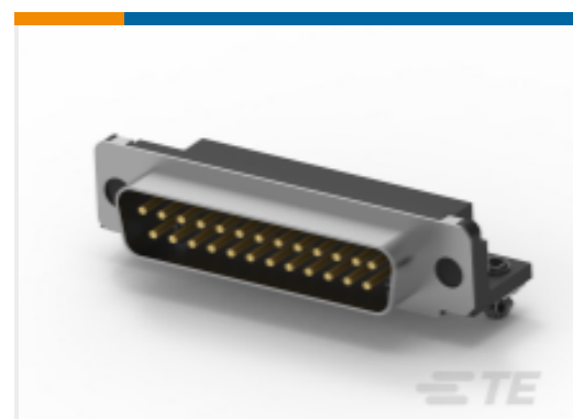
TE 系列/零件编号 747842-4 25 MSFL PLUG RA 318 (IN, FM,BL)