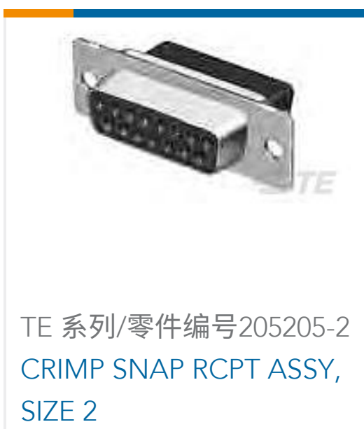
TE 系列/零件编号 205205-2 CRIMP SNAP RCPT ASSY, SIZE 2