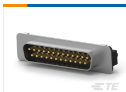
TE 系列/零件编号 2-5747704-0 25 PLUG SP/FMS BRDLK