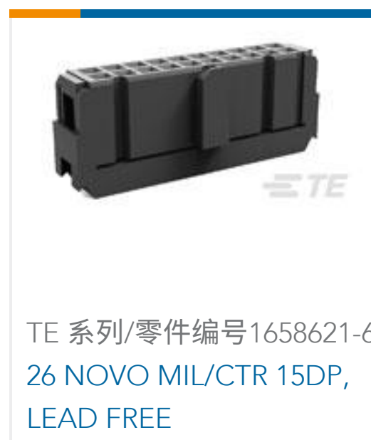
TE 系列/零件编号 1658621-6 26 NOVO MIL/CTR 15DP, LEAD FREE