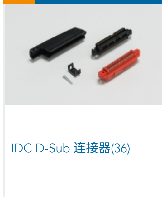
IDC D-Sub 连接器(36)