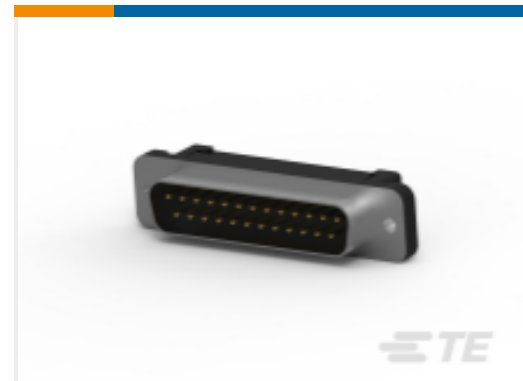
TE 系列/零件编号 1658608-2 25 POS HDF PLUG, MS, LEAD FREE