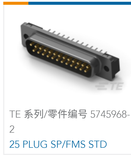
TE 系列/零件编号 5745968-2 25 PLUG SP/FMS STD