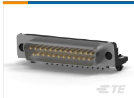
TE 系列/零件编号 5747842-4 25 MSFL PLUG RA 318 (IN, FM,BL)