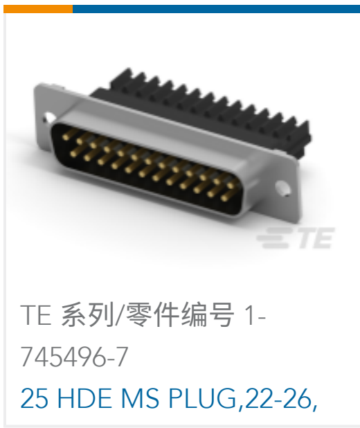
TE 系列/零件编号 1-745496-7 25 HDE MS PLUG, 22-26, LEAD FREE