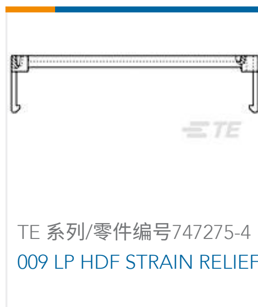
TE 系列/零件编号 747275-4 009 LP HDF STRAIN RELIEF