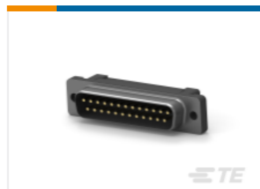
TE 系列/零件编号 1658613-2 25 POS HDF PLUG, MS, LEAD FREE