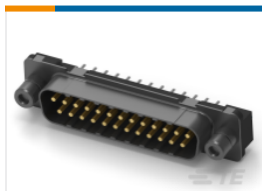
TE 系列/零件编号 3-338311-2 25POS.HD20 PLG ASSY