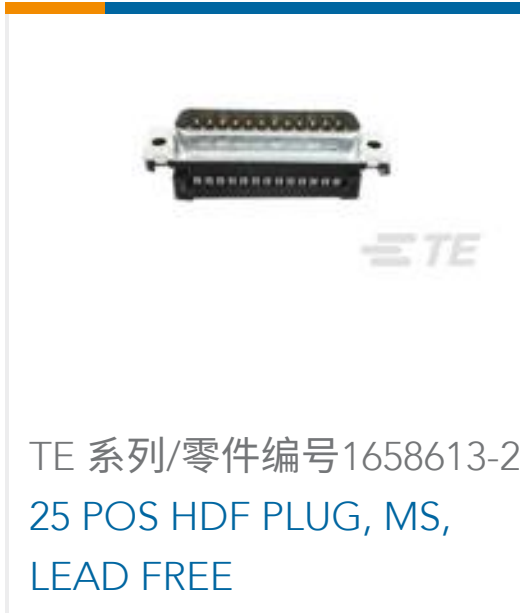
TE 系列/零件编号 1658613-2 25 POS HDF PLUG, MS, LEAD FREE