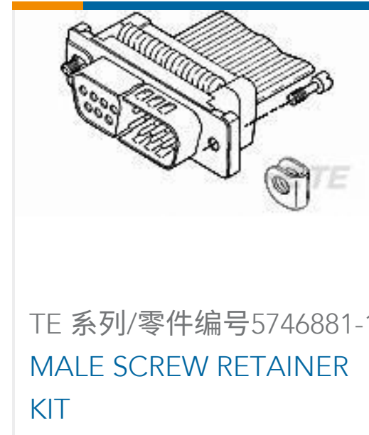
TE 系列/零件编号 5746881-1 MALE SCREW RETAINER KIT