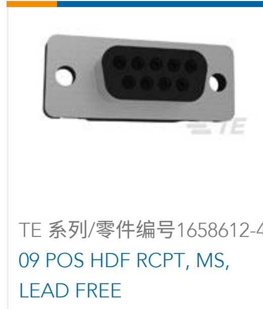
TE 系列/零件编号 1658612-4 09 POS HDF RCPT, MS, LEAD FREE