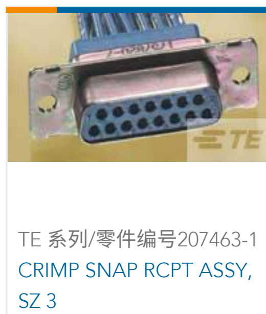
TE 系列/零件编号 207463-1 CRIMP SNAP RCPT ASSY, SZ 3