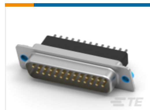
TE 系列/零件编号 5745959-1 25 PLUG SP/MS CNUT