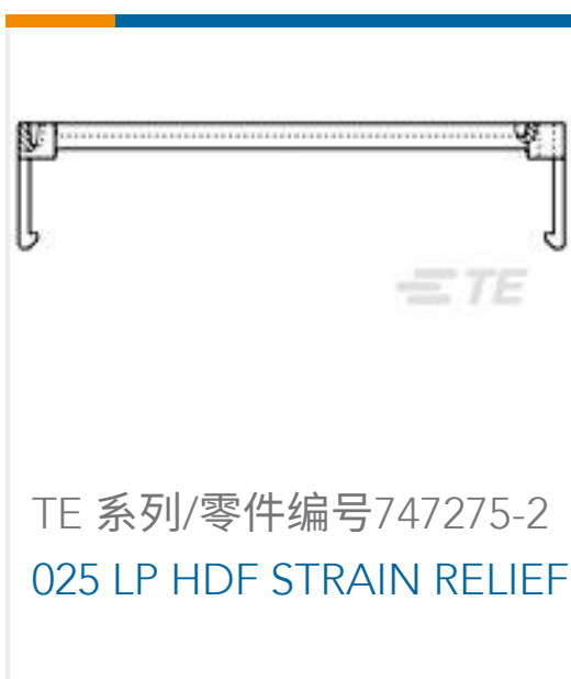
TE 系列/零件编号 747275-2 025 LP HDF STRAIN RELIEF