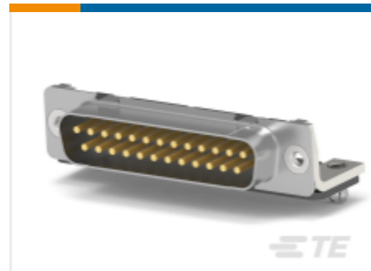
TE 系列/零件编号 1-338170-2 25P.HDP20 PLUG ASSY