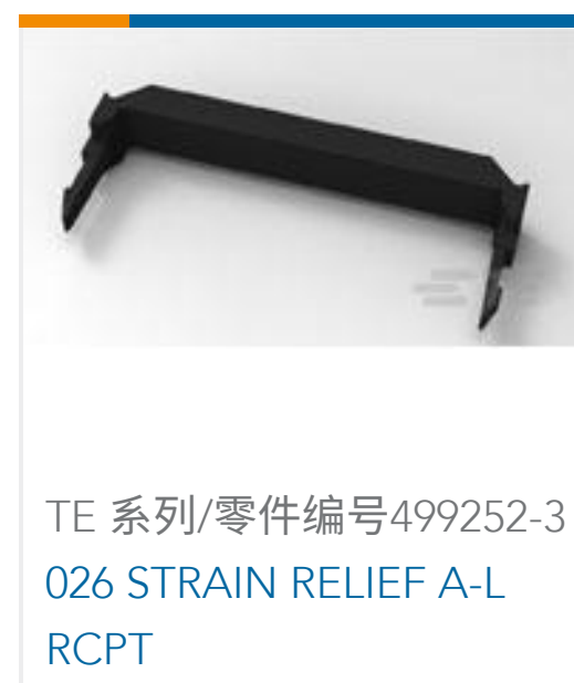
TE 系列/零件编号 499252-3 026 STRAIN RELIEF A-L RCPT