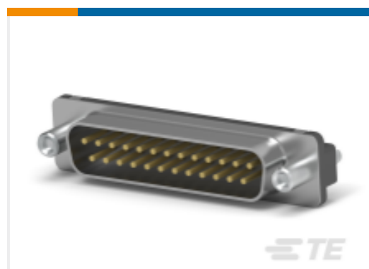
TE 系列/零件编号 5748027-1 25 PLUG SP/FMS (IN,SL)