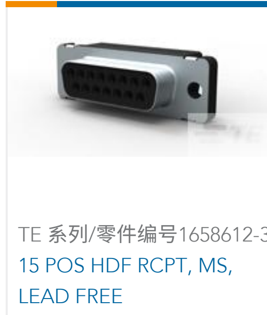
TE 系列/零件编号 1658612-3 15 POS HDF RCPT, MS, LEAD FREE