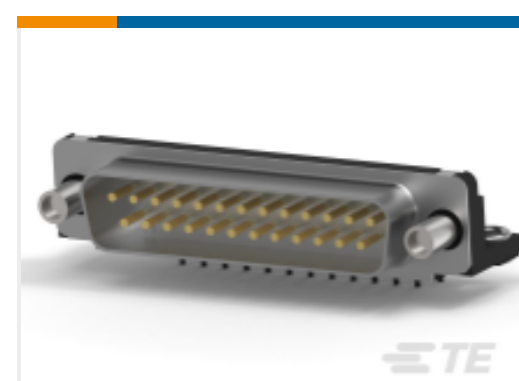
TE 系列/零件编号 5747238-6 25 MSFL PLUG RA 318 (SL, FM)