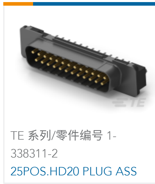
TE 系列/零件编号 1-338311-2 25 POS HD20 PLUG ASS