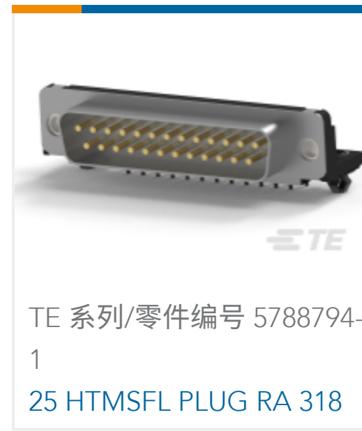
TE 系列/零件编号 5788794-1 25 HTMSFL PLUG RA 318 (IN, BL)