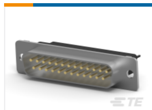
TE 系列/零件编号 5205737-7 25 PLUG SP/MS STD