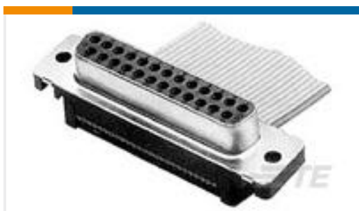
TE 系列/零件编号1658612-1 37 POS HDF RCPT, MS, LEAD FREE