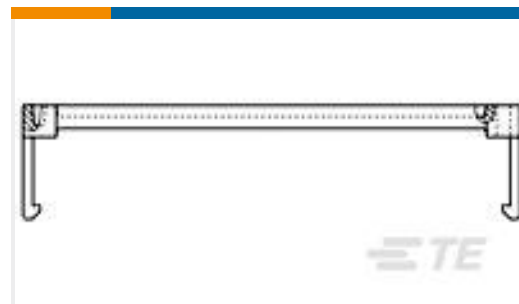
TE 系列/零件编号747275-1 037 LP HDF STRAIN RELIEF