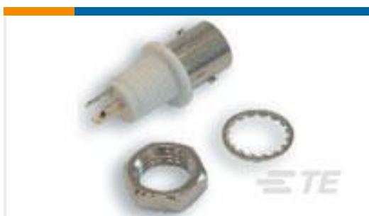
TE 系列/零件编号5- 1634504-1 BNC Ins BHSkt 50Ohm Nickel Gold Pltd