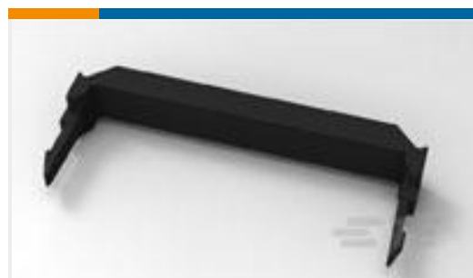
TE 系列/零件编号499252-4 050 STRAIN RELIEF A-L RCPT