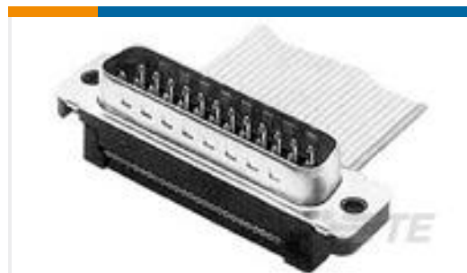
TE 系列/零件编号1658607-1 50 POS HDF PLUG, MS, LEAD FREE