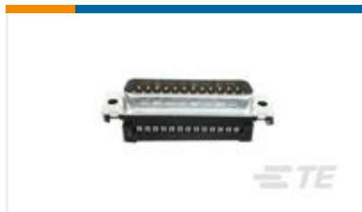
TE 系列/零件编号1658613-2 25 POS HDF PLUG, MS, LEAD FREE