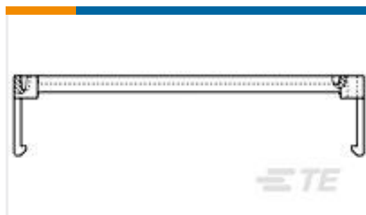
TE 系列/零件编号747275-2 025 LP HDF STRAIN RELIEF