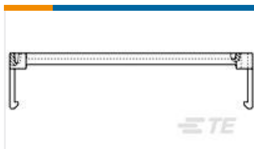
TE 系列/零件编号746785-1 50 POS STR RLF,LOW PROFILE