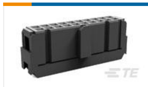
TE 系列/零件编号1- 1658621-0 50 NOVO MIL/CTR 15DP, LEAD FREE