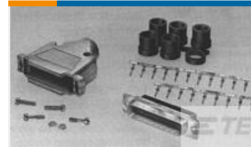
TE 系列/零件编号749805-7 KIT,HDP-20,PLUG,SIZE 1, 9 POSN