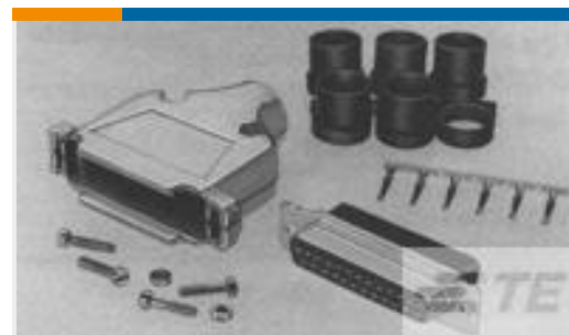
TE 系列/零件编号749806-9 KIT,HDP-20,RCPT,SIZE 3, 25 POS