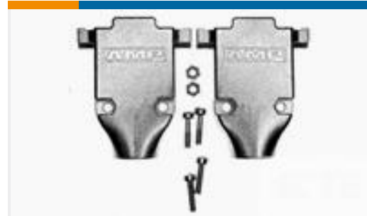
TE 系列/零件编号5748676-4 DIE CAST CBL CLMP KIT, SZ 4