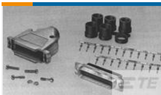
TE 系列/零件编号749805-9 KIT,HDP-20,PLUG,SIZE 3, 25 POS