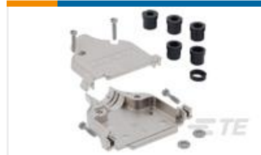
TE 系列/零件编号5748676-3 DIE CAST CBL CLMP KIT, SZ 3