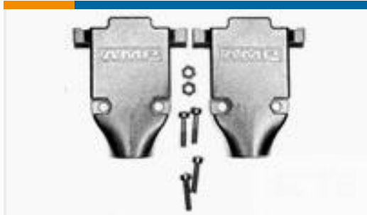
TE 系列/零件编号5748676-5 DIE CAST CBL CLMP KIT, SZ 5