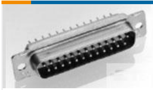
TE 系列/零件编号1757819-7 AMPLIMITE,ASY,PLUG, STD,109,ZN,2,CT