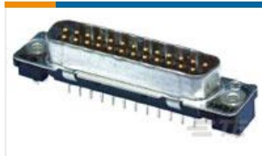
TE 系列/零件编号5745968-8 HD-20 25 PLUG SP/FMS INSRT