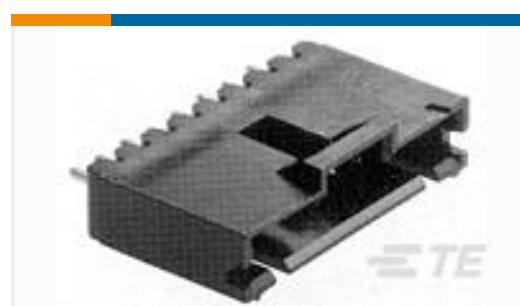
TE 系列/零件编号5-104362- 4 05 MTE HDR SRST LATCH W/HLDWN