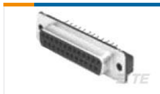
TE 系列/零件编号5747150-8 09 RCPT SP/FMS INSRT