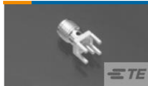
TE 系列/零件编号221789-1 JACK,PCB,SERIES SMA