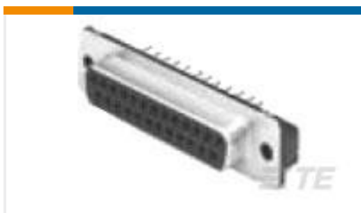
TE 系列/零件编号5747299-8 15 RCPT SP/FMS INSRT