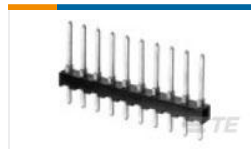
TE 系列/零件编号87220-3 03 MODII HDR SRST UNSHRD .100