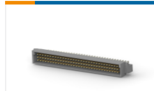
TE 系列/零件编号650473-5 096 EURO TYPE C PIN ST ASSY