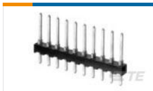
TE 系列/零件编号87224-2 02 MODII HDR SRST UNSHRD .100