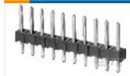
TE 系列/零件编号5-146281- 4 04 MODII HDR SRST B/A LF