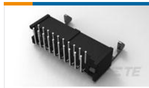
TE 系列/零件编号1761607-6 IDC LOW PRO HDR 16P RA LG LAT BLK