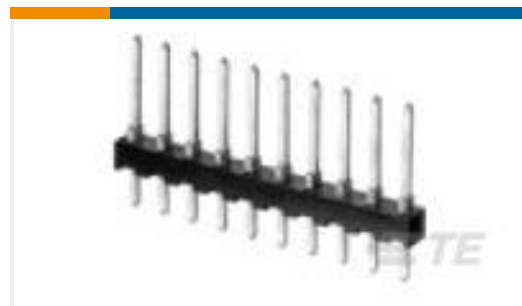
TE 系列/零件编号87220-2 02 MODII HDR SRST UNSHRD .100