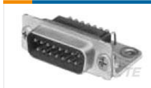
TE 系列/零件编号5747197-4 09 PLUG RA/MS STD (SL)