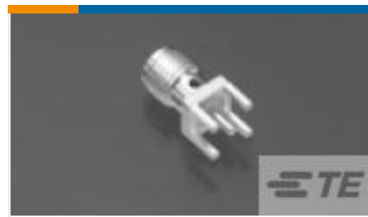
TE 系列/零件编号1053354-1 2062 0000 00,SMA PCB VERT JACK