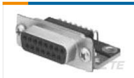
TE 系列/零件编号5747020-1 09 RCPT RA/MS STD (SL)