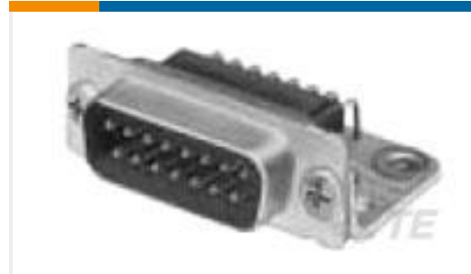
TE 系列/零件编号5747022-2 25 PLUG RA/MS STD (SL)