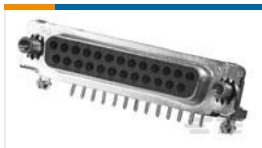
TE 系列/零件编号5747845-3 15 MSFL RCPT RA 318 (IN, FM,BL)