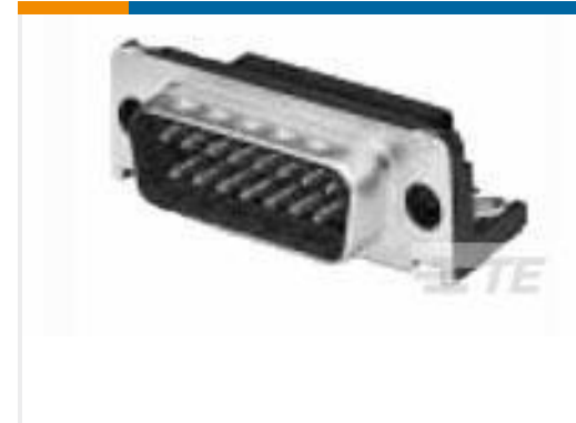
TE 系列/零件编号 5788794-2 25 HTMSFL PLUG RA 318 (IN,BL)