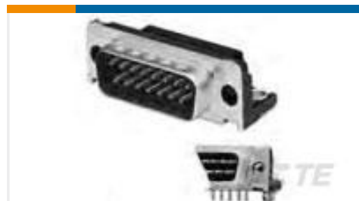
TE 系列/零件编号5747842-3 25 MSFL PLUG RA 318 (IN, FM,BL)