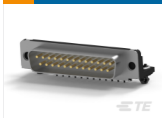
TE 系列/零件编号 5747842-2 25 MSFL PLUG RA 318 (FM, BL)