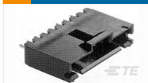
TE 系列/零件编号5-104363- 2 03 MTE HDR SRST LATCH . 100CL