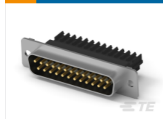
TE 系列/零件编号 1-745496-8 25 HDE MS PLUG,22-26, LEAD FREE