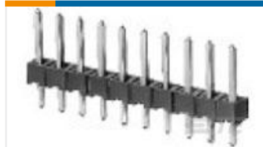
TE 系列/零件编号5-146280- 2 02 MODII HDR SRST B/A . 100CL