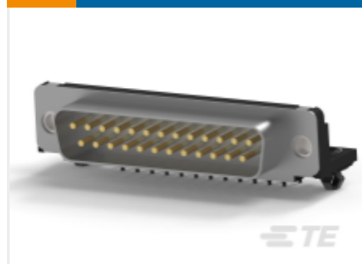
TE 系列/零件编号 5788794-1 25 HTMSFL PLUG RA 318 (IN,BL)