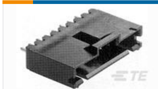
TE 系列/零件编号5-104362- 3 04 MTE HDR SRST LATCH W/HLDWN