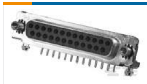
TE 系列/零件编号5747844-3 09 MSFL RCPT RA 318 (IN, FM,BL)