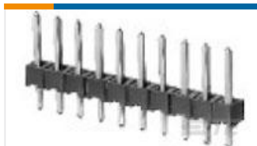
TE 系列/零件编号5-146280- 3 03 MODII HDR SRST B/A . 100CL