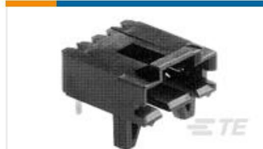
TE 系列/零件编号5-103673- 1 2 MTE HDR SRRA LATCH W/HLDWN