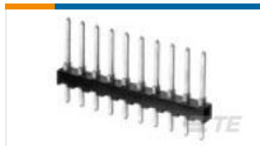
TE 系列/零件编号87220-2 02 MODII HDR SRST UNSHRD .100