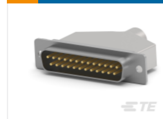
TE 系列/零件编号 1-747547-0 KIT,PLUG,25P,HDE,SHLD HDWRE