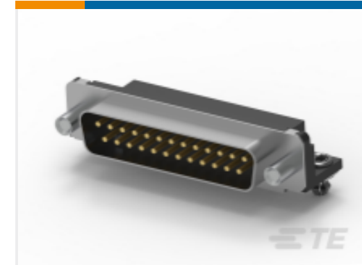
TE 系列/零件编号 5788795-1 25 HTMSFL PLUG RA 318 (SL,BL)