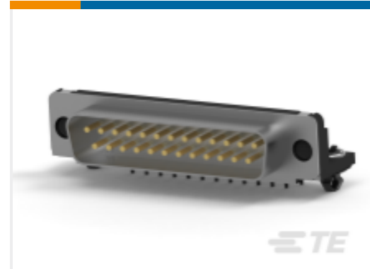
TE 系列/零件编号 5747842-3 25 MSFL PLUG RA 318 (IN, FM,BL)