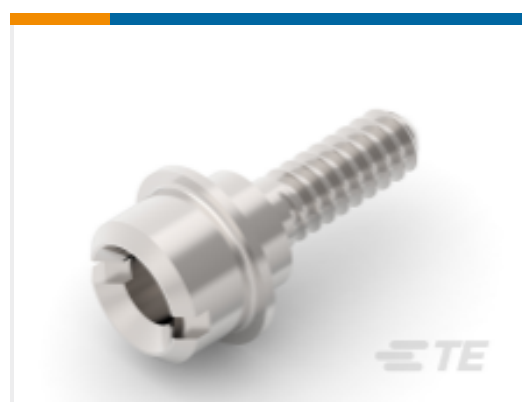
TE 系列/零件编号 786585-2 50SR SCREWLOCK KIT, FEMALE