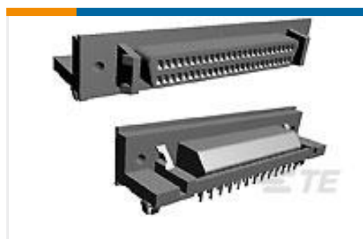
TE 系列/零件编号5787082-7 68 50SR R/A RCPT ASSY, RDSN L/F