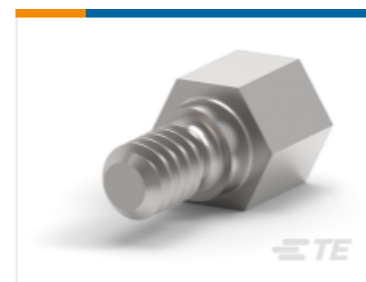
TE 系列/零件编号 749087-2 50SR SCREWLOCK KIT, FEMALE