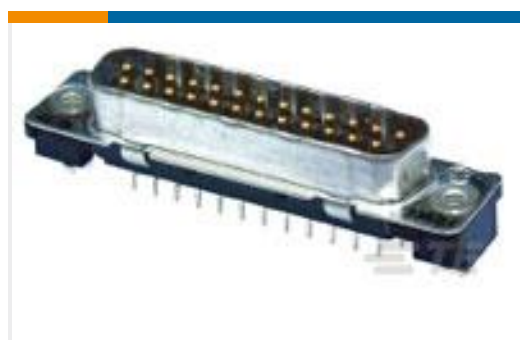
TE 系列/零件编号2- 5748003-0 09 PLUG SP/FMS BRDLK