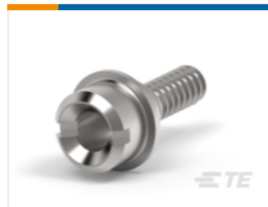
TE 系列/零件编号 786585-3 50SR SCREWLOCK KIT, BULK,FEMAL