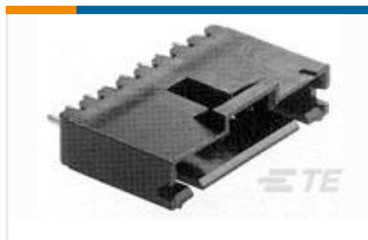
TE 系列/零件编号5-104362- 2 03 MTE HDR SRST LATCH W/HLDWN