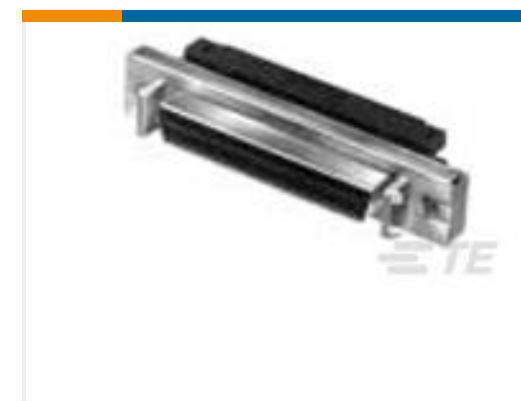
TE 系列/零件编号 5-749611-5 50 50SR PANEL MOUNT RCPT, ROHS