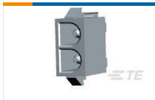
TE 系列/零件编号641964-1 02P UMNL PIN HDR ASSY POL 94VO