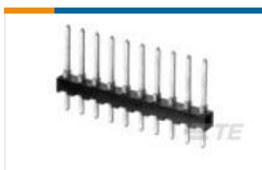
TE 系列/零件编号87220-3 03 MODII HDR SRST UNSHRD .100