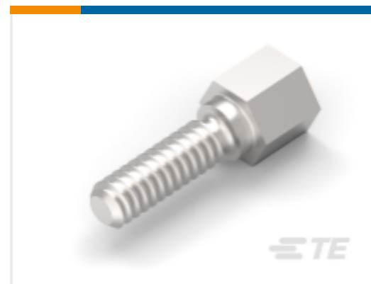
TE 系列/零件编号 749087-4 50SR SCREWLOCK KIT, FEMALE