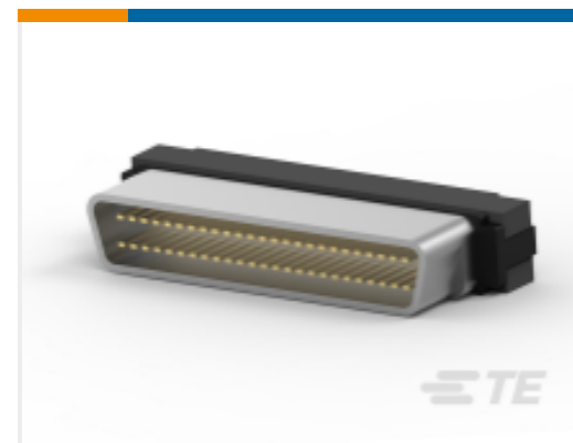
TE 系列/零件编号 5749621-5 50 50S CABLE PLUG CONN/COV KIT