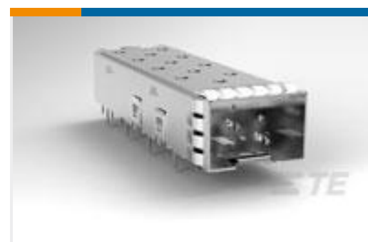
TE 系列/零件编号2007194-1 SFP+ 1x1 Cage Assembly, PCI, Solder Tail