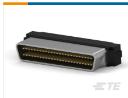
TE 系列/零件编号 5750913-5 50 50SR CABLE CONN KIT