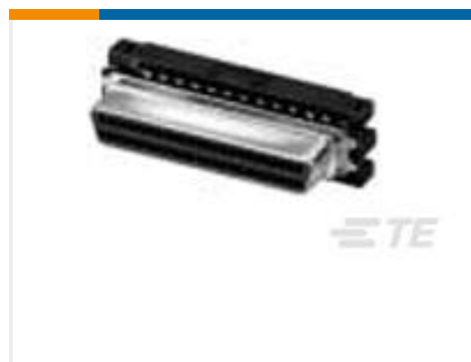
TE 系列/零件编号 5749210-5 50 50SR CABLE RCPT ASSY