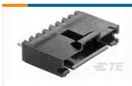
TE 系列/零件编号5-104363- 5 06 MTE HDR SRST LATCH . 100CL