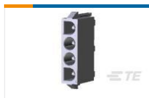
TE 系列/零件编号641968-1 04P UMNL PIN HDR ASSY POL 94VO