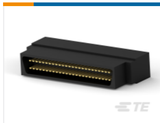
TE 系列/零件编号 5390377-5 50 POS A/P PLUG 25 CL 30AU