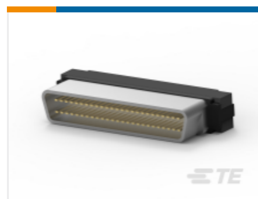
TE 系列/零件编号 5749111-4 50 50SR CABLE PLUG ASSY