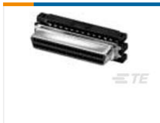
TE 系列/零件编号 5749699-5 50 50SR CABLE RCPT KIT