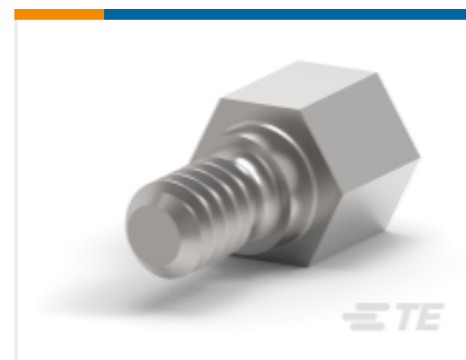
TE 系列/零件编号 749087-3 50SR SCREWLOCK KIT, FEMALE