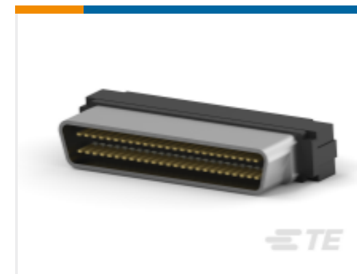
TE 系列/零件编号 1-5750913-5 50 50SR CABLE CONN KIT