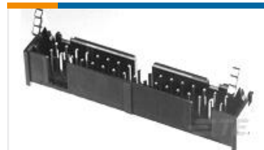
TE 系列/零件编号1761606-3 IDC LOW PRO HDR 10P VERT LG LAT BLK