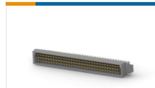
TE 系列/零件编号650473-5 096 EURO TYPE C PIN ST ASSY