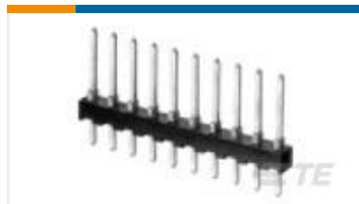
TE 系列/零件编号87224-6 06 MODII HDR SRST UNSHRD .100