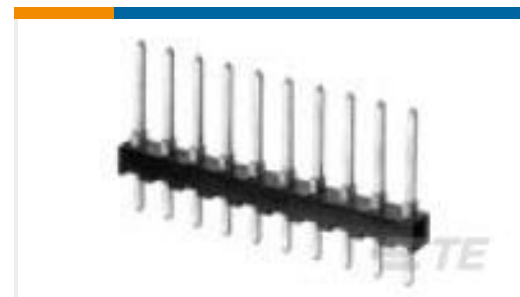
TE 系列/零件编号87220-2 02 MODII HDR SRST UNSHRD .100