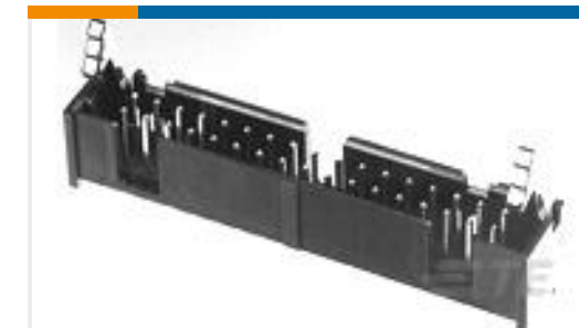
TE 系列/零件编号1761608-3 IDC LOW PRO HDR 10P VERT SHT L