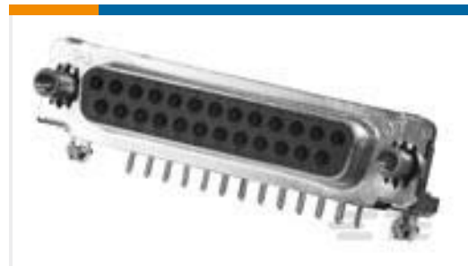
TE 系列/零件编号5747844-5 09 MSFL RCPT RA 318 (SL, FM, BL)