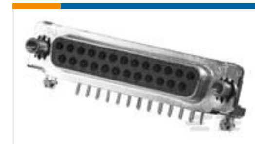
TE 系列/零件编号5747846-5 25 MSFL RCPT RA 318 (SL, FM, BL)