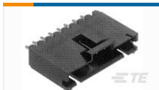
TE 系列/零件编号5-103735- 4 05 MTE HDR SRST LATCH . 100CL