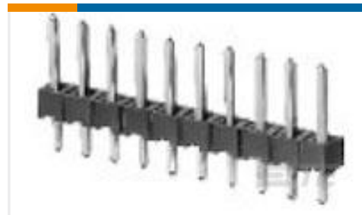
TE 系列/零件编号5-146281- 2 02 MODII HDR SRST B/A LF