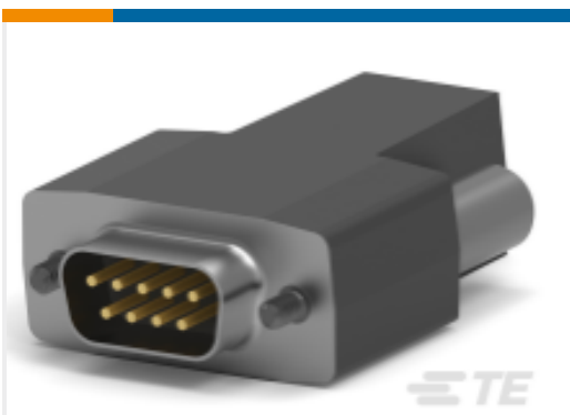
TE 系列/零件编号 1-747944-6 KIT,PLUG,9P,HDE,SHLD ENCLSRE