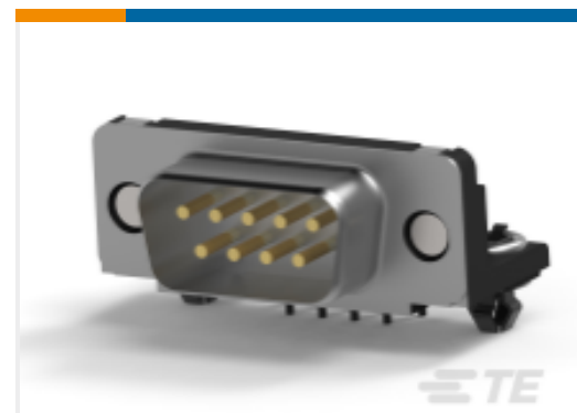
TE 系列/零件编号 5747840-3 HD-20 PLUG RA .318 FMS BD-LK 4