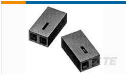
TE 系列/零件编号390088-2 BLACK HSG WITH 15AU CONTACT