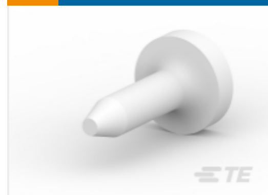
TE 系列/零件编号 206509-1 SIZE 20 KEYING PLUG