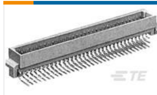
TE 系列/零件编号5650473-5 ASSY,PIN,EUROCARD, TYPE C,LEAD-