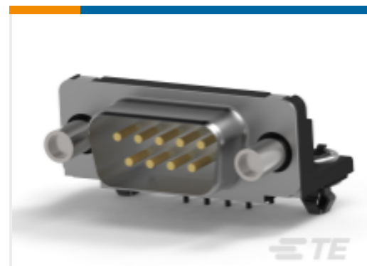
TE 系列/零件编号 5747840-5 HD-20 PLUG RA .318 FMS BD-LK S