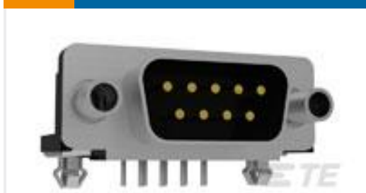
TE 系列/零件编号5747840-6 HD-20 PLUG RA .318 FMS BD-LK S