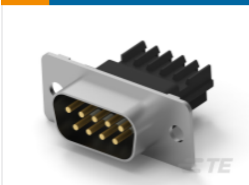
TE 系列/零件编号 2-745492-0 PLUG ASSY,9P,HDE,MS