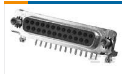
TE 系列/零件编号5747845-5 15 MSFL RCPT RA 318 (SL, FM,BL)