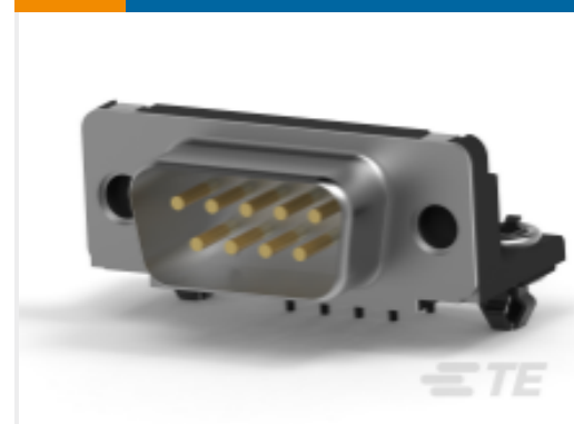
TE 系列/零件编号 5747840-2 HD-20 PLUG RA .318 FMS BD-LK